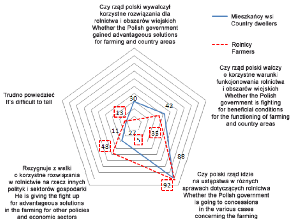
Rys. 2. Opinie o stanowisku rządu polskiego w odniesieniu do implementacji i realizacji WPR w Polsce w 2012 roku (%)

Pomimo stosunkowo powszechnej wiary rolników w postawę polskiego rządu (35% rolników i 42% mieszkańców wsi twierdzi, że rząd „walczy” o polską wieś), niemal w połowie są oni przekonani o nieuchronności ustępstw w sprawach rolnictwa na rzecz innych bardziej innowacyjnych dziedzin gospodarki.