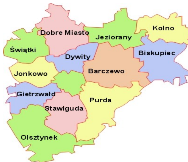
Rys. 2. Struktura administracyjna powiatu olsztyńskiego