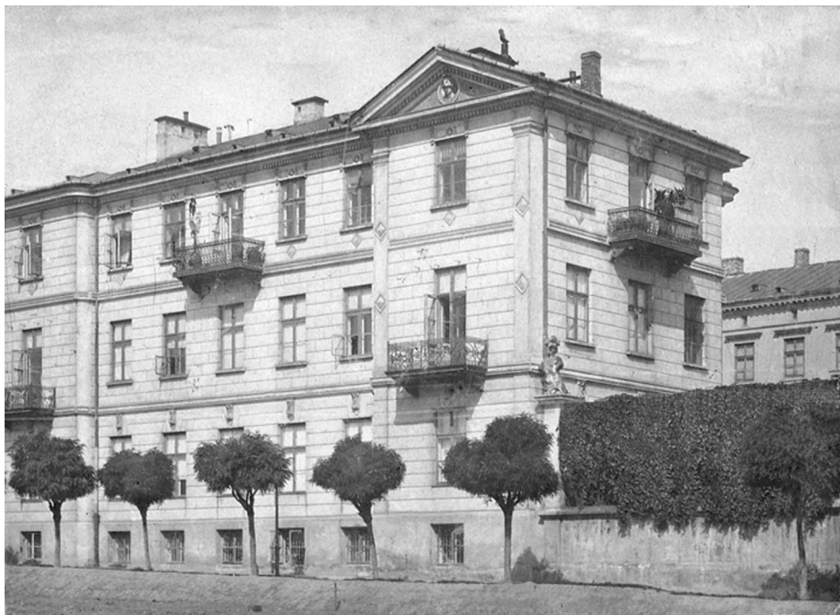
1096 r. Pierwsza siedziba przy ul. Smolnej

praw szkół akademickich państwowych Uczelnia uzyskała osobowość prawną, a jej absolwenci, poza dyplomem zawodowym, mogli uzyskać tytuł magistra, a także stopień doktora nauk ekonomicznych 2 . Dyplomy WSH zrównano z analogicznymi dokumentami szkół państwowych.