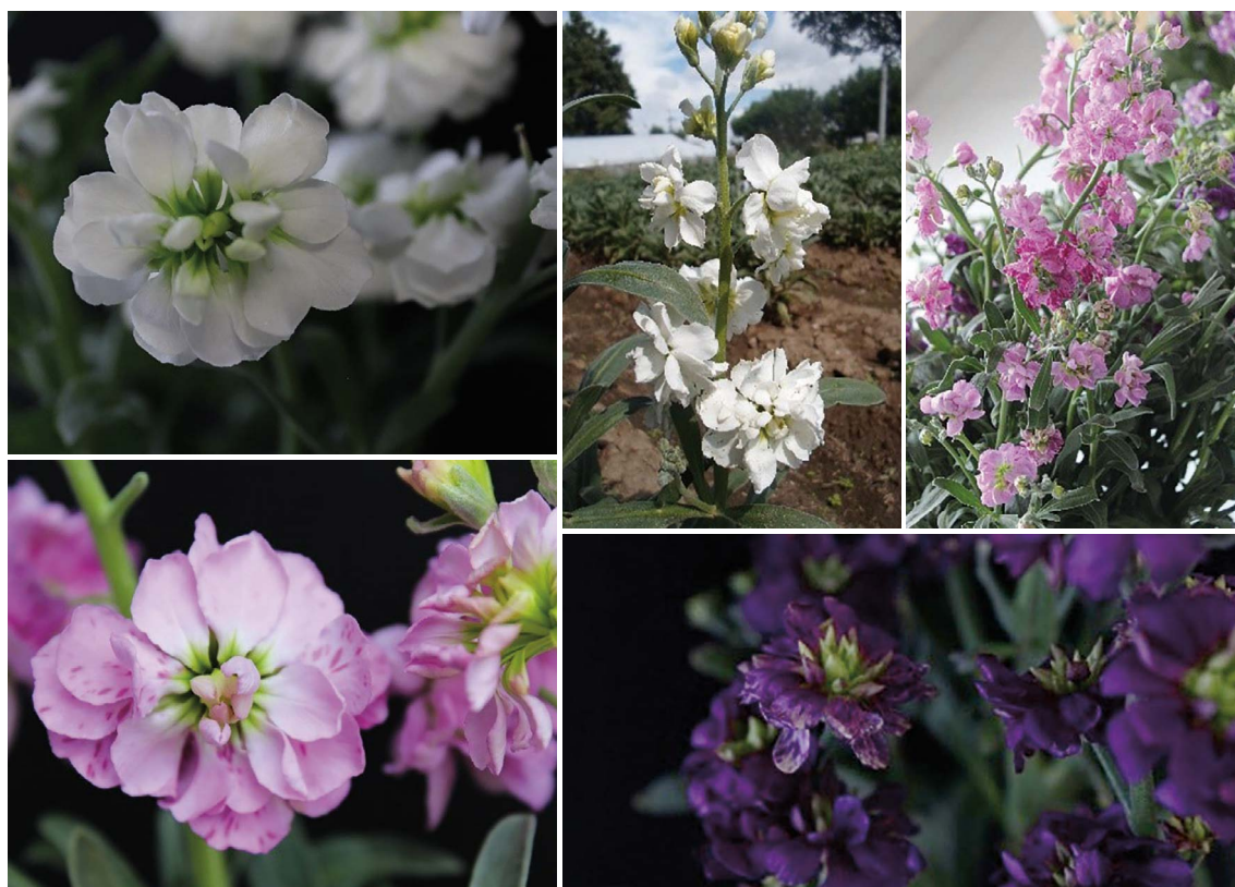
Figura 1. Flores de alhelí ( Matthiola incana ).

experimento se realizó en el Laboratorio de Embriogénesis del Colegio de Postgraduados, Campus Montecillo (19° 27' 46" N y 98° 54' 17" O) (Colpos) Estado de México. Las variables evaluadas en los tres genotipos fueron: