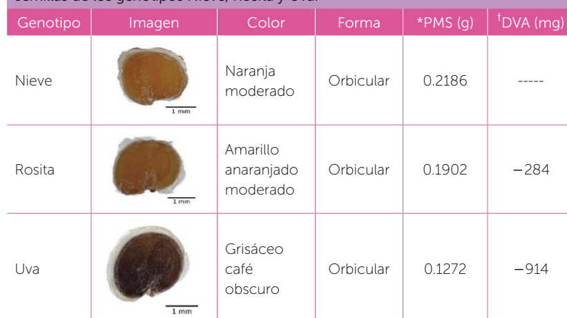
Cuadro 1. Color, forma, peso de mil semillas y diferencia al peso más grande de semillas de los genotipos Nieve, Rosita y Uva.

*PMS: Peso de mil semillas; †DVA: Diferencia al valor más alto.