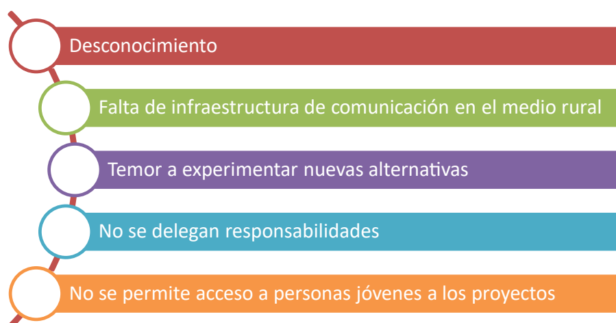
Figura 4. Elementos que influyen en la falta de apropiación de TICs en los proyectos de turismo rural

y comercialización en el proceso de interacción con los clientes potenciales. En este sentido, se propone que la creación de plataformas virtuales de comercialización de alojamientos rurales es un mecanismo para el aprovechamiento óptimo las TICs, aumentando los ingresos económicos de las familias rurales mediante el incremento en las reservaciones de alojamiento rural. Se observó que estos procesos de comercialización a partir de las TICs, están fuertemente regulados por las opiniones de las comunidades y la calificación colectiva de los servicios adquiridos, por lo que una es-