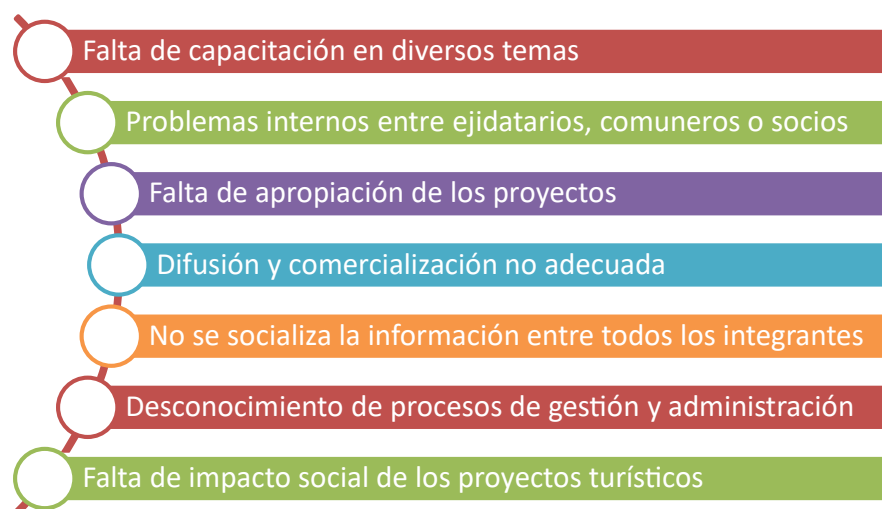
Figura 3. Problemáticas que enfrentan los parques ecoturísticos Fuente: Trabajo de campo 2018-2019.

De esta manera, a partir del diagnóstico, se identificó que de los ocho proyectos que están en operación ofreciendo servicios de alojamiento rural, no todos cuentan con páginas web para su comercialización o promoción. Tomando como base estos comparativos, se corrobora la información brindada por los informantes clave respecto a la poca difusión y comercialización realizada a través de las TICs, misma que se ve reflejada en las redes sociales de cada uno de los proyectos. Esta situación implica que hasta el momento, las TICs no han sido adoptadas por los representantes ni integrantes de los