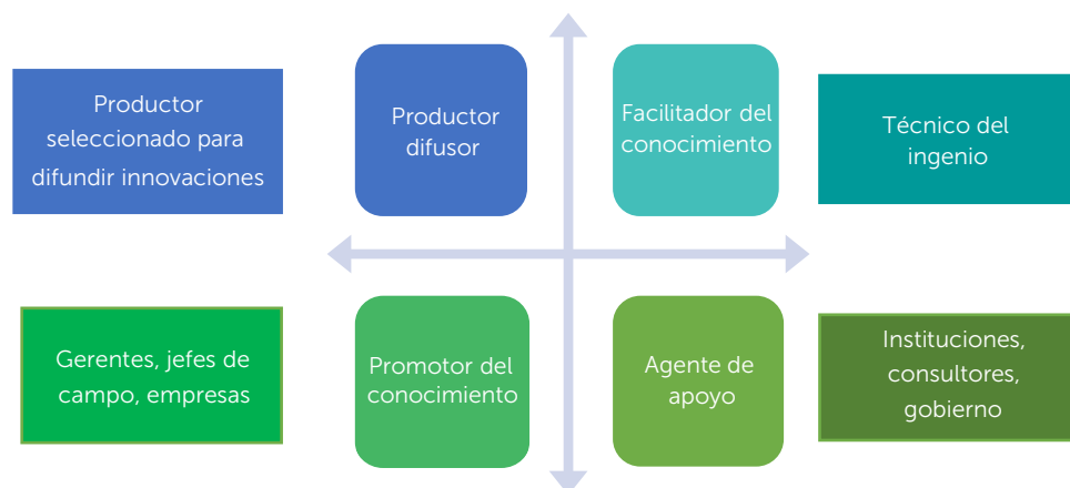
Figura 1. Componentes del sistema de innovación en la producción de caña de azúcar con base en principios de educación para adultos.

Se hizo una propuesta metodológica denominada productor difusor/productora difusora, mismo que se basa en elegir productores para convertirse en actores que transfieran tecnología y formen a sus pares. Se espera que estos productores y productoras operen dentro del marco de un sistema de innovación, con el apoyo de diversos actores que soporten los procesos de difusión (Figura 1). La capacitación se enfoca no únicamente en componentes técnicos como tradicionalmente se concibe para el sector agropecuario, sino que se deben considerar aspectos de desarrollo humano y educación de adultos, utilizando técnicas bajo los principios de la andragogía y la psicología. Con elementos de la educación constructivista que aborden principios cognitivos o de desarrollo