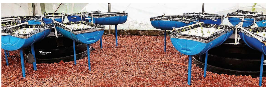
Figura 2. Sistema acuapónico para la producción de lechugas en un sistema de raíz flotante, abastecido de nutrimentos a partir de los efluentes del cultivo de tilapias.

su adopción y apropiación es que los productores requieren de conocimientos técnicos básicos para manejar ambos sistemas (acuicultura e hidroponía) como una unidad acuapónica, dada su tradicional tendencia a producir solo plantas. Por ello, se deben desarrollar estrategias en paralelo que permitan capacitar a los potenciales productores con mayor eficiencia y rapidez.