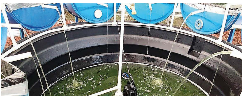
Figura 1. Sistema de recirculación del efluente acuícola para la oxigenación y purificación del sistema acuapónico.