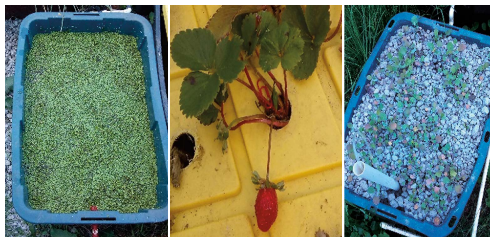
Figura 2. Crecimiento de lenteja de agua, fresa, canola.

la lemna tiene entre 0.5 a 0.8% de fósforo con respecto al contenido de materia seca (Mbagwu y Adeniji, 1988).