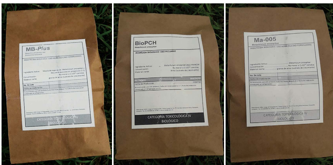
Figura 2. Presentación comercial de los biopesticidas a base de hongo Metarhizium anisopliae para el control de la mosca pinta ( Aeneolamia sp.) en caña de azúcar, pastos y hortalizas.