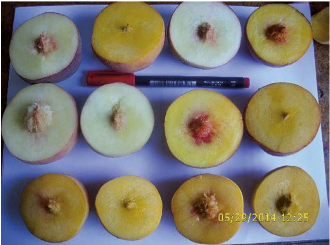
Figura 2. Características visuales de frutos de durazno de las variedades sobresalientes.