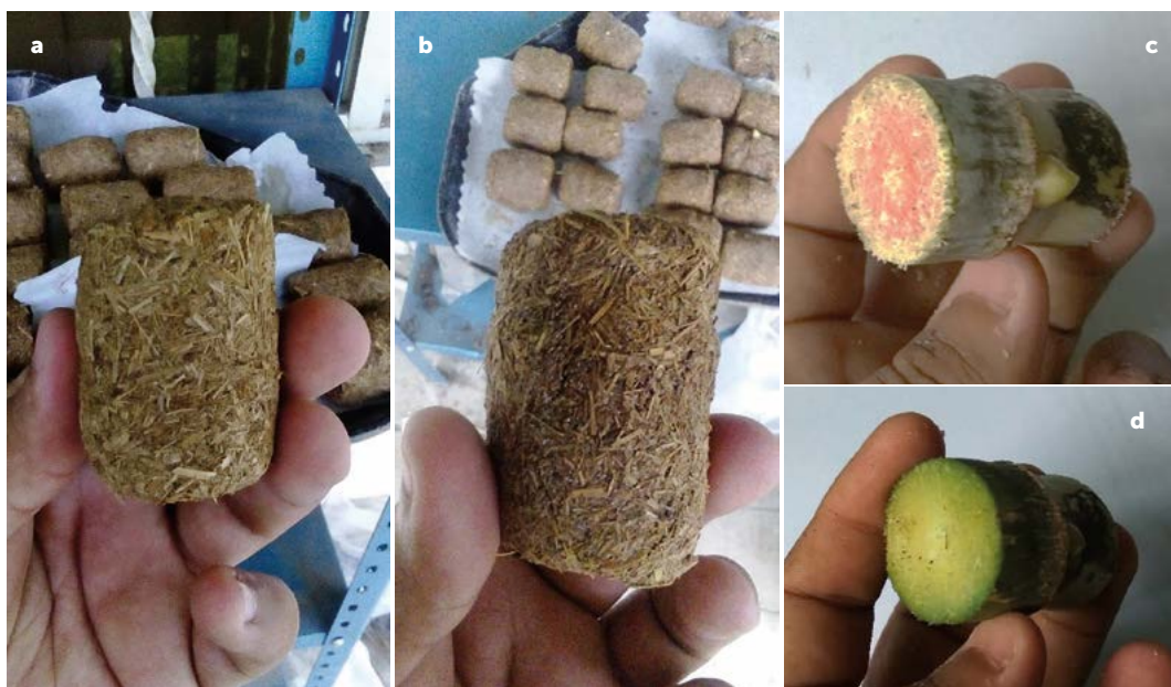
Figura 1. Tratamientos de encapsulado. a: almidón al 15%. b: alginato de sodio al 2% + cloruro de calcio al 10%. c: yema sin encapsulado. d: yema recién cortada.

Las yemas encapsuladas se sumergieron en la solución de cloruro de calcio por cinco minutos, para la solidificación del polímero y posteriormente se colocaron en una bandeja de plástico para dejarlos secar durante 72 h a la sombra a temperatura ambiente ( 28 \pm 2 °C). El grosor del encapsulado fue de aproximadamente 5 mm (Figura 1).