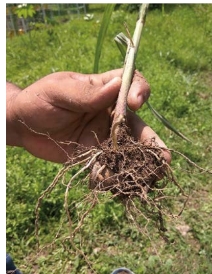
Figura 3. Desarrollo del sistema radical de la plántula a partir de yemas de Saccharum spp., mediante vehículo elaborado con almidón al 15%, o "semilla artificial".