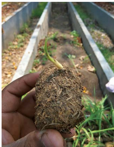
Figura 2. Germinación de yemas de Saccharum spp., mediante el vehículo de almidón al 15%

En lo que respecta a la altura de tallo, en el análisis de varianza se observaron diferencias altamente significativas entre tratamientos. La prueba de medias de Tukey, indicó que T1 y T4, presentaron la mayor altura de tallo (49.6 y 54.6 cm, respectivamente), mientras que la menor altura fue de plántulas de T3 (30 cm) (Cuadro 1).