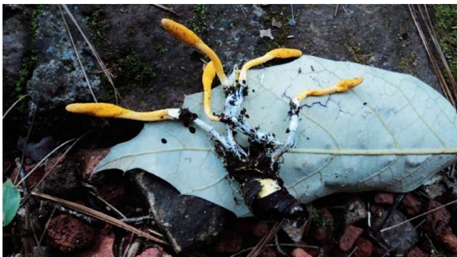
Figura 3. Estroma del hongo silvestre Cordyceps sp., colectado en Tenancingo, Estado de México (López, 2017).

empírico sobre el recurso fúngico (Martínez et al. , 2005). De acuerdo con esta premisa, y con respecto a los hongos entomopatógenos y micoparásitos del grupo Cordyceps s.l., la especie con potencial como alimento funcional para ser aprovechado en México es T. ophioglossoides . Por tanto, también es importante realizar investigaciones etnomicológicas, dirigidas a conocer el uso que dan los pobladores a estas especies, ya que como se mostró a lo largo del escrito, la mayoría de las especies muestran alto potencial en la producción de fármacos con propiedades anticancerígenas, antioxidantes y antibióticas, primordialmente.