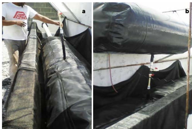
Figura 2. Unión de los componentes del biodigestor: a: cuerpo del biodigestor con salida del biogás en la parte superior, b: cuerpo y reservorio unidos mediante un tramo de tubería de PVC.

El estiércol presentó contenidos de 45.3% y 1.7% de carbono orgánico y de