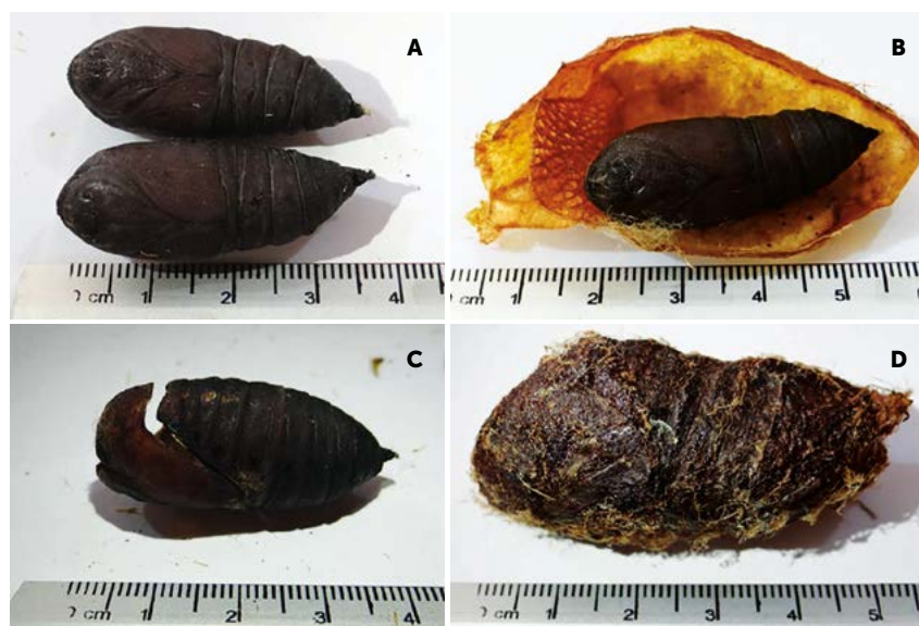
Figura 3. Color y tamaño de pupas (A), posición que adopta la pupa dentro del capullo durante la metamorfosis (B), exuvia de pupa (C), forma, color y tamaño del capullo (D).

esta investigación es que no existe una emergencia homogénea lo cual afecta la búsqueda de pareja para realizar la copula y la fecundación de los huevos. Balcazar, (2016) menciona que en la subfamilia Hemileucinae las especies suelen presentar manchas parecidas a ojos en las alas posteriores y cuando estas especies se encuentran en reposo durante el día, tales manchas suelen estar cubiertas por las alas anteriores, pero si se les molesta las muestran rápidamente con la intención de asustar, sorprender o distraer a potenciales depredadores diurnos,