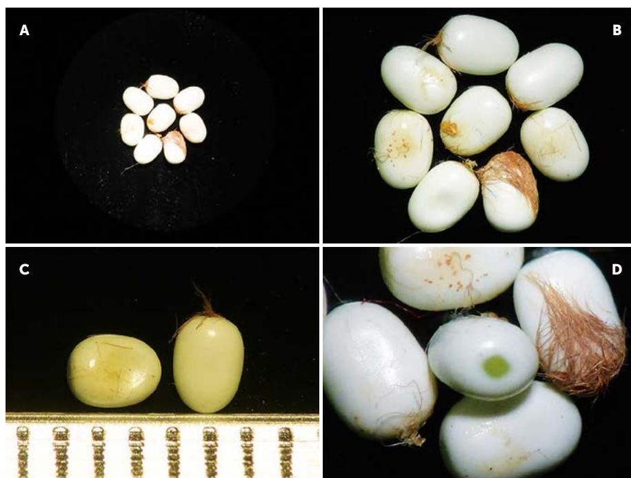
Figura 1. Forma, color, tamaño y posición del micrópilo en huevo de L. viridescens (A-D).

Las pupas son obrectas, de color café oscuro, presentan dimorfismo sexual en cuanto a tamaño, la hembra es ligeramente más grande que el macho. En esta etapa, permanecen entre seis y siete meses para que el adulto emerja; realizan diariamente movimientos abdominales circulares constantes dentro del