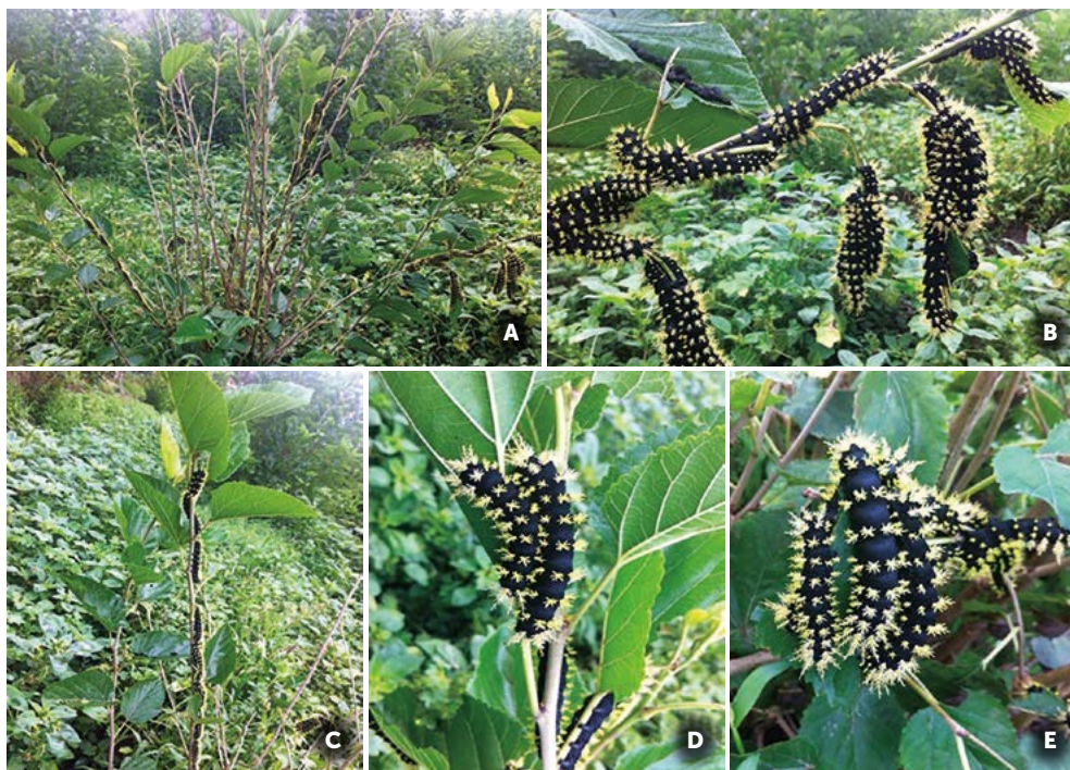
Figura 2. Larvas de L. viridescens alimentándose de las hojas del árbol de morera M. alba (A-D).

capullo. La posición final que adopta la larva y la pupa es con la cabeza dirigida hacia el opérculo u orificio de salida., este es construido de seda aproximadamente a un centímetro de la salida y presenta varios orificios diminutos para que entre el oxígeno y sea fácil de disolver y romper durante la emergencia del adulto. El capullo es de consistencia dura, áspera y ovalada, está construido con hojas. La seda gruesa y pegajosa de color café oscuro, muy semejante a la pupa, mide en promedio 6 cm de largo por 3 cm de ancho con suficiente espacio para los movimientos de la pupa. Finalmente, cuando emerge el adulto rompe la parte dorsal de la pupa y la exuvia queda dentro del capullo junto con la del último instar larval (Figura 3).