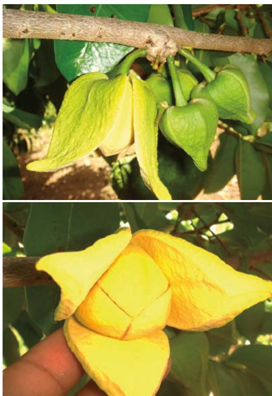
Figura 4. Floración de guanábana en alta densidad después de 90 días de la poda (arriba); flor lista para ser polinizada (abajo) en una plantación de ocho años de edad.