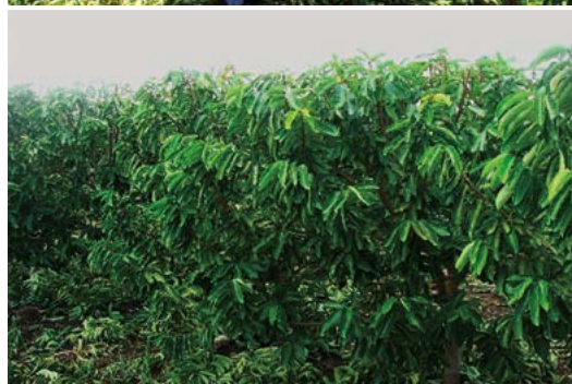
Figura 2. Árboles de guanábana en alta densidad después de ocho años de plantación (arriba); árboles de guanábana en alta densidad después de nueve años de plantación (abajo).