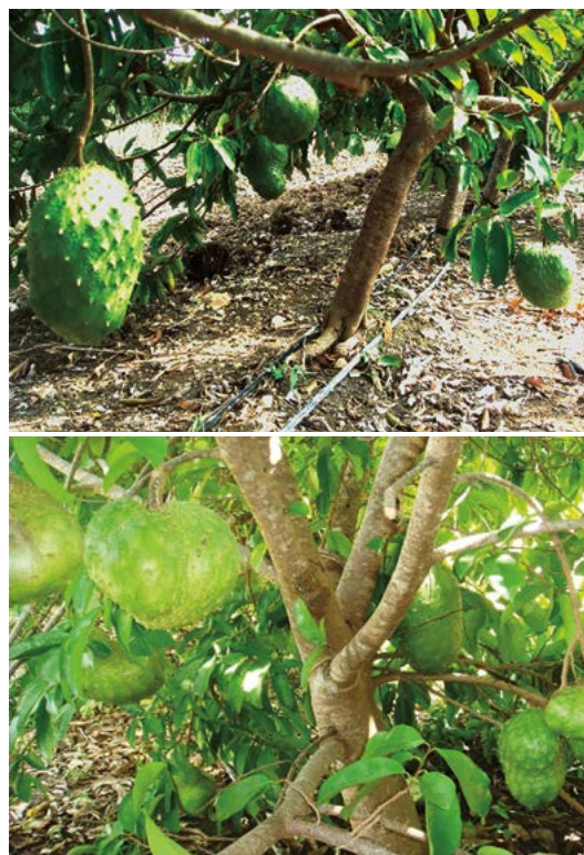
Figura 5. Árboles de guanábana en alta densidad con ocho años de edad Clon 12 (arriba); árboles de guanábana en alta densidad con nueve años de edad Clon 10 en producción (abajo).

paración de las espinitas del fruto (tricomas) se amplían, esto indica que el fruto tiene madurez fisiológica y está listo para cortarse. La metodología para la siembra y manejo de guanábana en altas densidades de producción, se encuentra disponible en el Colegio de Postgraduados Campus Campeche, Carretera Federal Haltunchen-Edzná, km 17.5, Sihochac, Champotón, Campeche.