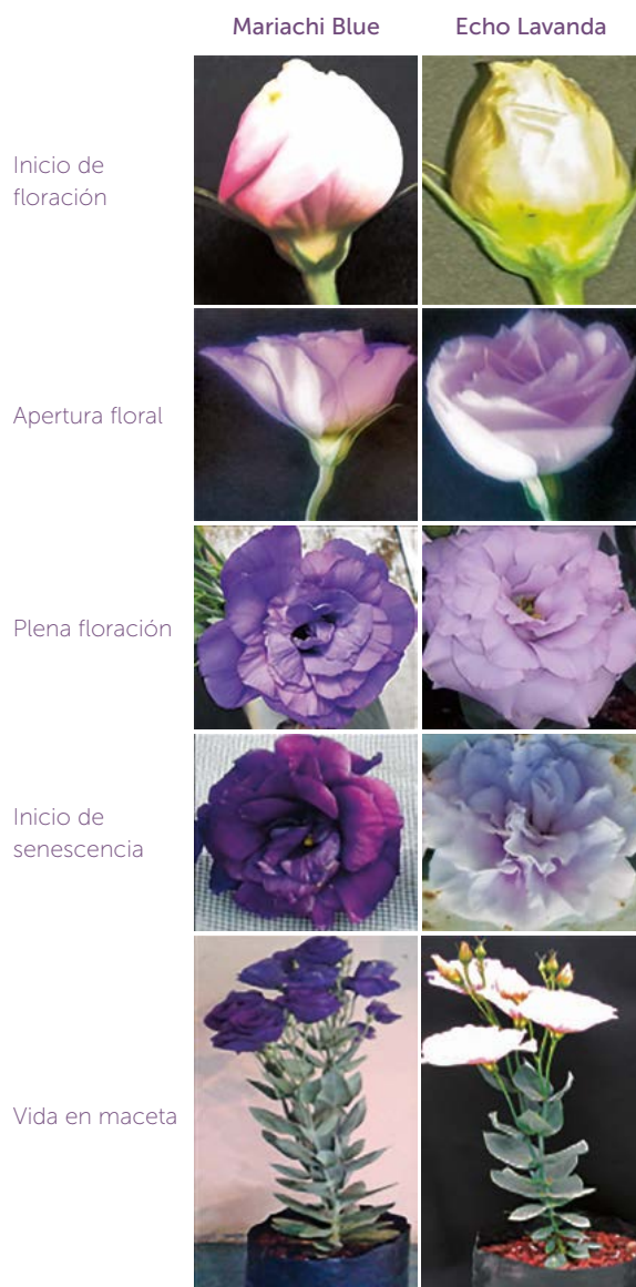
Figura 1. Fases del ciclo fenológico de dos variedades de lisianthus evaluadas en esta investigación.

El IS en la variedad Mariachi Blue se registró a los 189, 199 y 201 ddt en los tratamientos 0, 0.075 y 0.150 mM Phi, respectivamente. El IS es un indicador de la duración del ciclo de lisianthus; por tanto, es evidente que con el tratamiento con Phi éste se prolongó (Figura 2). Melgares de Aguilar (1996) reportan para lisianthus un ciclo de 90 a 120 días de plantación a floración. Asimismo, Camargo et al. (2004) determinaron un ciclo productivo de 120 días para esta especie. En este estudio, el ciclo en general fue mayor, lo que puede ser atribuible a la variedad utilizada, al manejo de la plántula en la casa comercial y