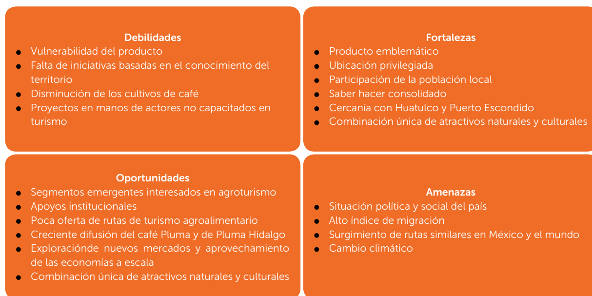
Figura 2. Análisis de Fortalezas, Oportunidades, Debilidades y Amenazas (FODA) como estrategia de diagnóstico con el objetivo de determinar los factores principales involucrados en la planeación del proyecto del circuito agroturístico del café Pluma como un negocio en el municipio de Pluma Hidalgo, Oaxaca, México.

Es necesaria la planeación estratégica en manos de personas capacitadas en proyectos similares, pues con