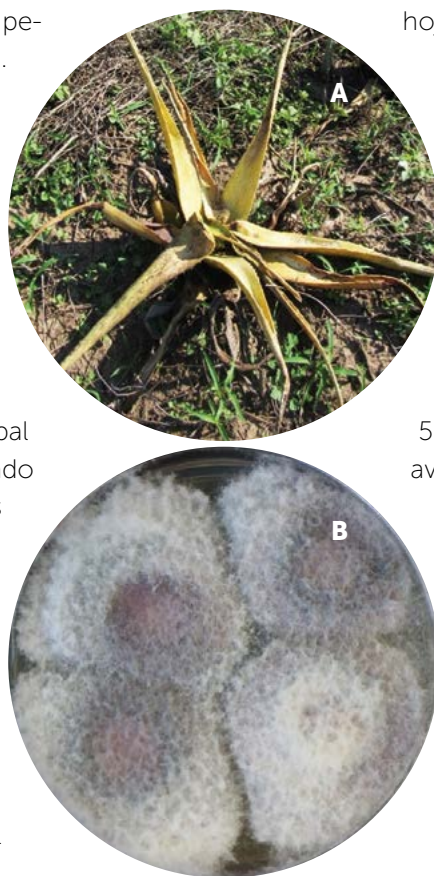
Figura 2. A) Crecimiento de Fusarium en medio de cultivo Agar dextrosa de papa B) Síntomas de plantas de Aloe enfermas por causa del fitopatógeno Fusarium (Necrosis en la raíz, amarillamiento y marchitez de las hojas).

Uno de los organismos causales de la pudrición blanda de la sábila es Dickeya gen. nov. (ex. Erwinia chrysanthemi , Pectobacterium chrysanthemi ) (Samson et al., 2005; Palacio-Bielsa y Cambra-Alvares, 2008). Las especies de este género bacteriano causan importantes