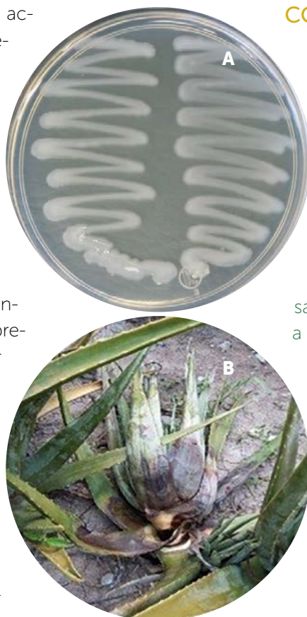
Figura 3. A) Crecimiento de Dickeya chrysanthemi en medio de cultivo de Agar Bacteriológico. B) Síntomas de plantas de Aloe enfermas por causa del fitopatógeno Dickeya chrysanthemi (Pudrición blanda en tallo que se extiende a través de las hojas).

El género Dickeya puede causar pudrición foliar en sábila, con heridas en la base de las hojas y a partir de ahí comienza a degradarse la pared vegetal causando una putrefacción de rápido avance provocando, dentro de la epidermis una formación de gas, inflándose y posteriormente liberando una masa fangosa (Mandal and Maiti 2005; Pedroza y Gómez, 2014). Los síntomas de la enfermedad consisten en lesiones necróticas que presentan una consistencia acuosa al comienzo de la infección y que posteriormente se torna seca del tercio superior de las hojas tiernas del cogollo, una vez que la enfermedad está avanzada el tercio superior se desprende (Figura 4) terminando así el avance del daño dejando solo una cicatriz necrosada (Pedroza et al., 2011).