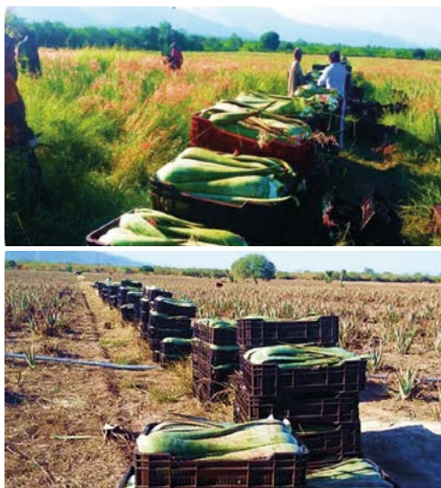
Figura 1. Cosecha de la hoja de sábila en el municipio de Xicoténcatl, Tamaulipas.

liares a Physalospora sp., Alternaria sp., Exserohilum sp., Botryodiplodia sp., Macrophoma sp., Microsphaeropsis sp., Cercosporidium sp., Corynespora sp., y Phyllosticta sp., y en cuanto a las pudriciones radicales se encontró Phytophthora nicotianae , Pythium ultimum , Fusarium oxysporum , Rhizoctonia solani y Sclerotium rolfsii (Lugo et al., 2004). Por otro lado, en las regiones de Asia, Europa y Norte América se han reportado enfermedades en la sábila provocadas por bacterias de los géneros Erwinia , Dickeya y Pectobacterium pertenecientes al grupo pectolítico (Kumar et al., 2011). Debido a la escasa información que se tiene sobre las enfermedades de la sábila, el objetivo de este trabajo ha sido recopilar información acerca de las principales enfermedades de la sábila y los fitopatógenos que las causan.