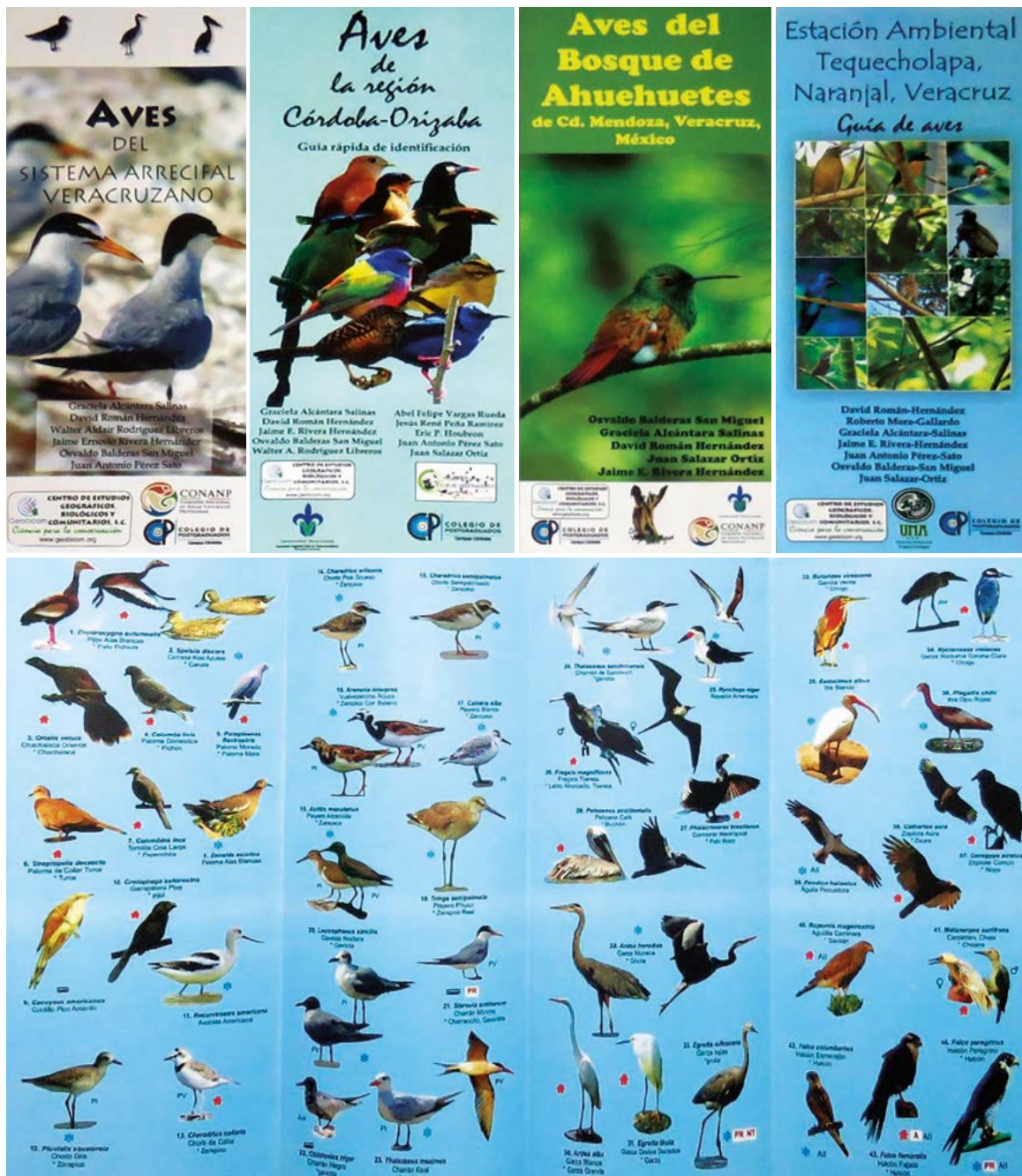
Figura 4. Guías rápidas de identificación de aves.