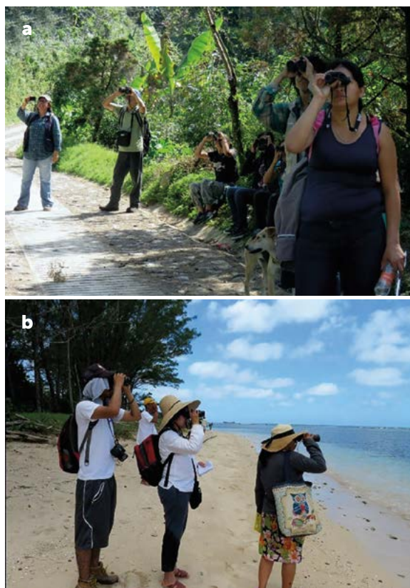
Figura 2. Red de monitoreo comunitario de aves de las Altas Montañas al Mar. a) Monitoreo de aves en la comunidad de Tepexilotla, en Chocamán y b) Monitoreo de aves en las playas e islas del Sistema Arrecifal Veracruzano.

En 2014 se creó el Club de Observadores de Aves de Córdoba-Orizaba, como una iniciativa de Geobicom, S.C., la Universidad Veracruzana y Colegio de Postgraduados (COLPOS) Campus Córdoba, con el fin de que