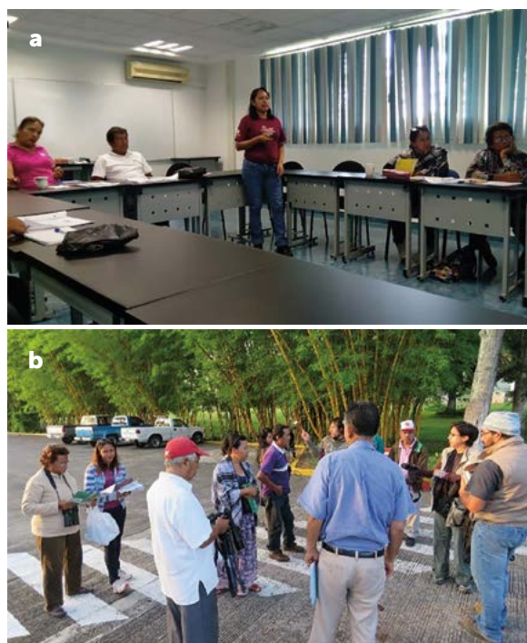
Figura 1. Curso de capacitación a monitores comunitarios de aves. a) Curso teórico en salón y b) práctica de observación de aves. Fotografías: a) D. Román-Hernández y b) M.L. Santos-Martínez

Como seguimiento a estos talleres y a manera de continuar con la capacitación, se organizó una visita a cada una de estas ocho iniciativas turísticas que participaron en