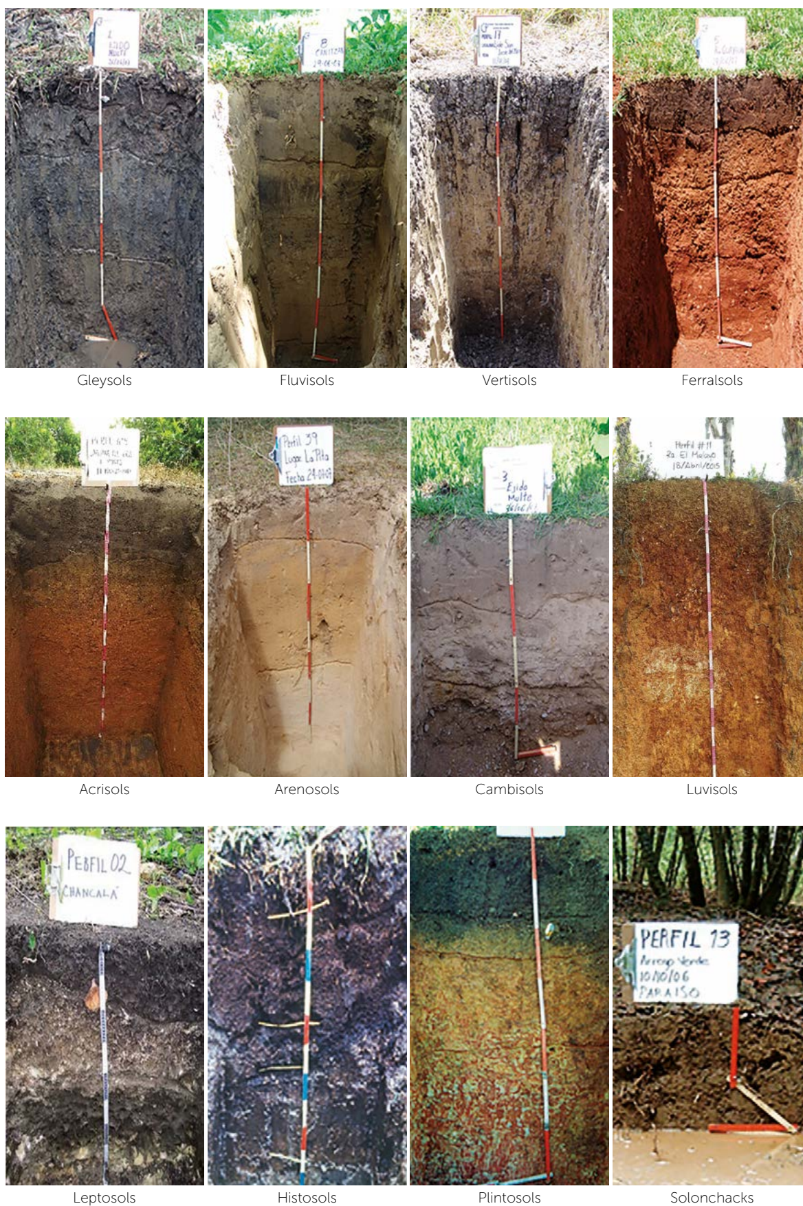
Figura 2. Perfiles de los Grupos de suelos más representativos en Tabasco, México.