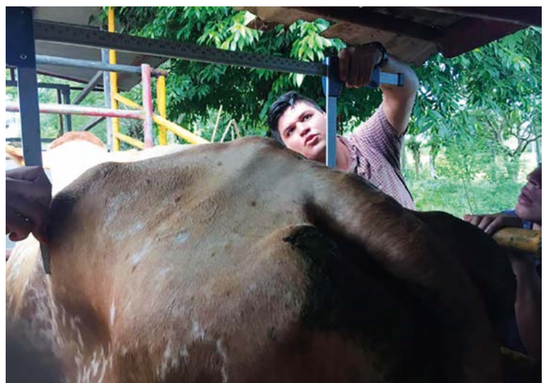
Figura 1. Determinación del ANCAD para estimar el peso vivo (kg) de novillas tropicales de reemplazo utilizando una forcípula.

Los valores promedios con \pm desviación estándar, y mínimos y máximos del PV y ANCAD de las novillas se muestran en el Cuadro 1. El PV varió de 128 kg a 550 kg, mientras que la ANCAD varió de 27 cm a 58 cm (Figura 2). El coeficiente de correlación ( r ) entre el PV y ANCAD