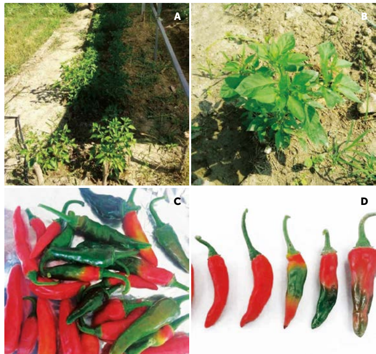
Figura 1. Plantas de chile siete caldos ( Capsicum annuum ) y las diversas tonalidades de sus frutos bajo condiciones de cielo abierto.

Los resultados muestran que los frutos de chiles siete caldos cultivados en condiciones de cielo abierto presentan un porcentaje de humedad