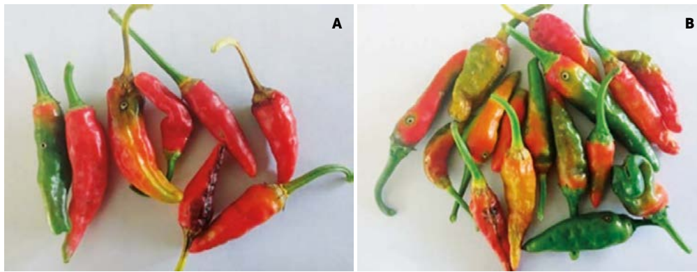
Figura 3. Frutos de Chile siete caldos ( Capsicum annuum ) infectados por A. eugenii bajo condiciones de cielo abierto (A) y casa sombra (B).