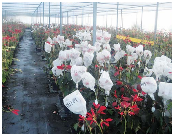
Figura 1. Frutos en desarrollo producto de cruzamientos manuales del Programa de mejoramiento genético de Euphorbia pulcherrima Willd. ex Klotzsch, en Campo Experimental Zacatepec, México.

como sustrato mezcla de Ocochal, peat moss y tepojal (Osuna et al. , 2012) en proporción 40:40:20 v/v. Las macetas con los esquejes plantados se colocaron dentro de una estructura metálica, con techo y paredes de polietileno blanco-opaco. Los esquejes enraizaron a los 28 días después del corte. Las nuevas plantas se cambiaron a una estructura metálica, con techo de polietileno blanco-opaco, transmisividad de 30% y malla sombra de