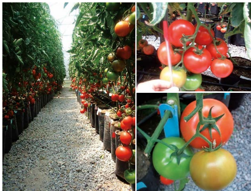
Figura 4. Aspecto del cultivo y las plántulas de jitomate ( Solanum lycopersicum Mill., var. Juanita) a 122 DDS.