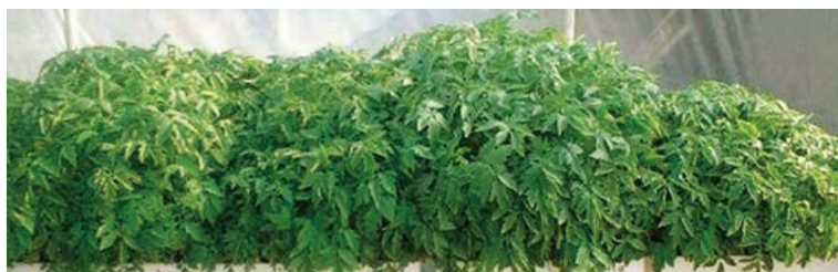
Figura 2. Aspecto de las plántulas de jitomate ( Solanum lycopersicum Mill., var. Juanita) inoculadas con cepas de Azospirillum al tiempo del trasplante (71 DDS).

como resultado de la elongación celular y asimilación del carbono por fotosíntesis. Uno de los fitoreguladores relacionados con el incremento en el contenido de clorofila, promoción indirecta de la biogénesis de cloroplastos y estimulación de la tasa fotosintética son las giberelinas (Jiang et al. , 2012), comúnmente producidas por el género Azospirillum (Perrig et al. , 2007). Al respecto, se ha reportado que la inoculación de plántulas de trigo con Azospirillum , incrementa la cantidad de varios pigmentos fotosintéticos (Bashan et al. , 2006). Este resultado, puede representar ventajas durante la producción de plantas que pasan por un periodo de almácigo, ya que estas plantas deben estar sanas y vigorosas, con buena formación de raíz, hojas y con tallos gruesos para soportar eficientemente el estrés producido durante el trasplante (Grime, 1979; Leskovar y Cantliffe, 1991; Chapin III et al. , 2002) (Figura 2).