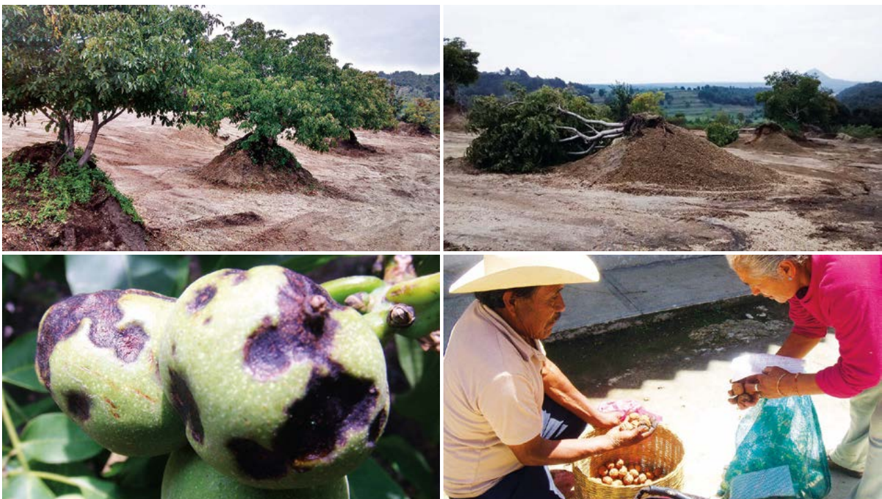
Figura 1. Cambio de uso de suelo, extracción de materiales de construcción, daño por enfermedades y venta de nuez de Castilla ( Juglans regia L)

En los meses de junio a septiembre de 2012 se realizaron recorridos en los municipios de San Nicolás de los Ranchos, San Andrés Calpan, Huejotzingo y Domingo Arenas, Puebla (2200 a 2400 m). Durante estas fechas, se recolectaron frutos de nogal de castilla con cáscara o xocota de árboles conservados en traspatios (100 frutos por árbol). De cada recolecta se determinaron ocho caracteres de nuez con base