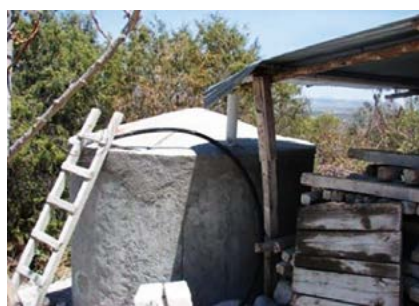
Figura 3. Cisternas de ferrocemento para la captación de agua de lluvia.

blema, se planteó la capacitación para la construcción de 25 estufas ahorradoras de leña en sus diferentes modalidades (Lorena, Lodo, Patsari, entre otras), además, se promovió la utilización de 10 hornos solares y construyeron 20 deshidratadores solares de alimentos (Figura 4).