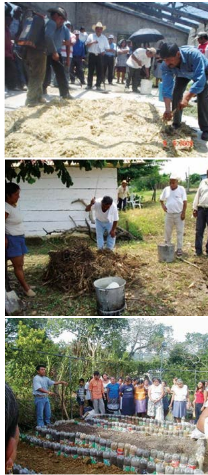
Figura 2. Elaboración de compostas y reciclado de envases como barrera para detener el suelo para la producción de hortalizas.

siembra de hortalizas (Figura 2). En este rubro se atendieron 15 municipios de los 24 participantes y en total 22 localidades (Cuadro 2). Destacó la asistencia técnica, beneficiando a 132 productores, seguido de los talleres con 68 beneficiarios.