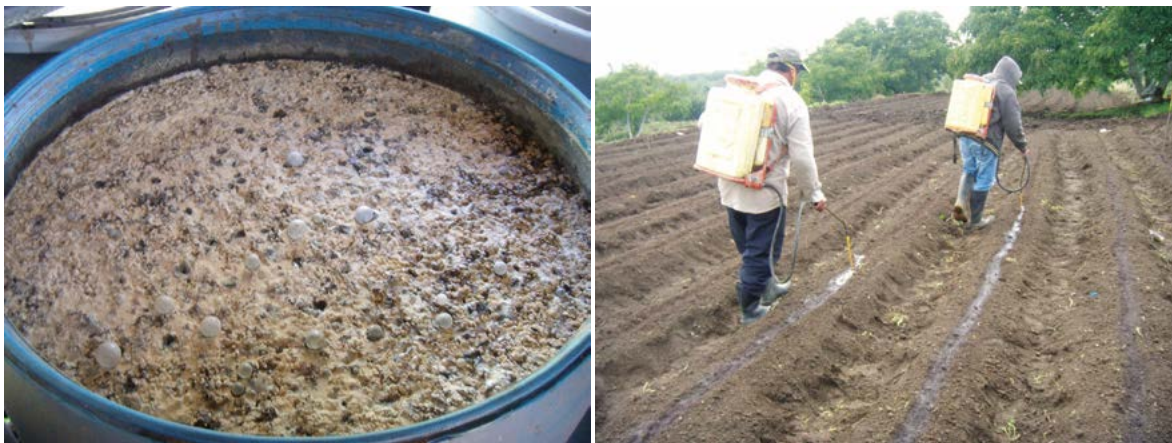
Figura 4. Aplicación al suelo de digeridos de fermentación antes de la siembra de especies ornamentales en Santa María Nepopualco Puebla, México.

jo, vacuno y equino presentaron elevada fitotoxicidad, y el digerido de ovino una fitotoxicidad moderada, por lo que se requiere mayor tiempo de fermentación previo a la valoración agronómica y recomendación de los digeridos como fertilizantes orgánicos.