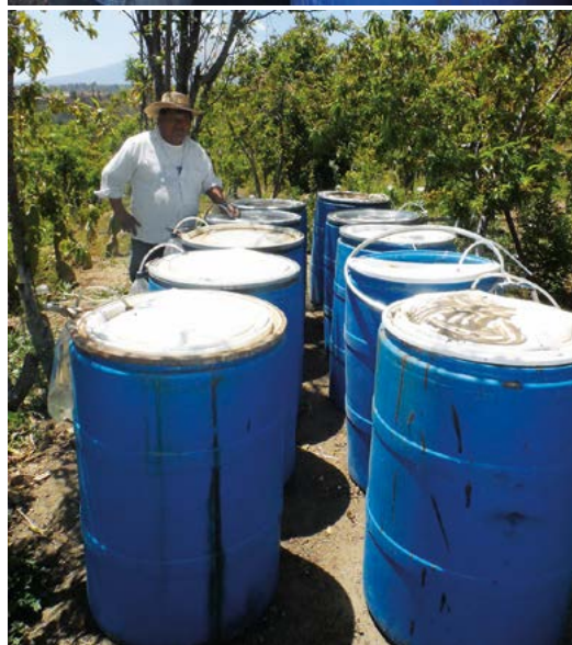
Figura 1. Producción de digeridos de fermentación o "bioles" en traspatios de unidades familiares campesinas en Santa María Nepopualco Puebla, México.