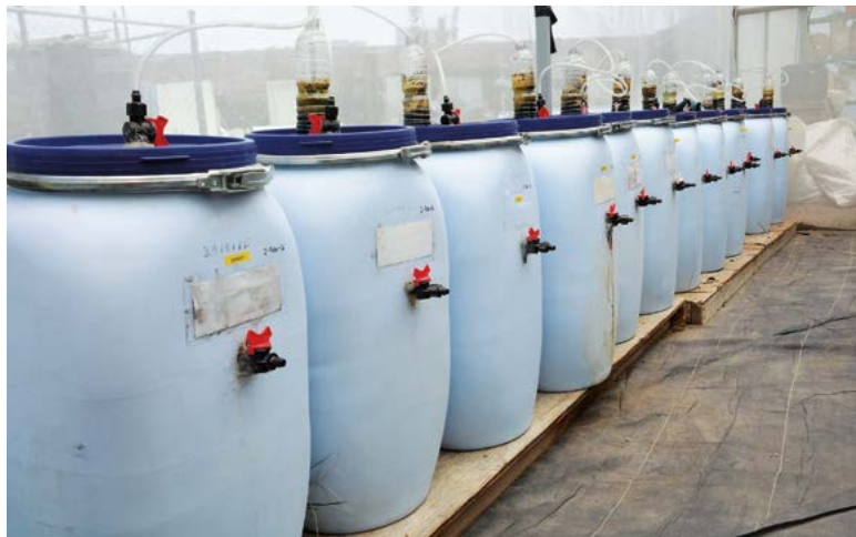
Figura 2. Digeridos para la producción de digeridos de fermentación.

indica Tiquia (2000). El Crr y el Ig se usan como indicadores de fitotoxicidad. Si el Ig es menor a 50% indica una alta fitotoxicidad, si va de 50% a 80% la fitotoxicidad es moderada y si es superior a 80%, el material no presenta fitotoxicidad (Emino y Warman, 2004). Se realizó una prueba de comparación de medias entre digeridos, con el paquete estadístico computacional Statistical Analysis System (SAS) versión 9.1 para Windows ® . Previo al análisis estadístico las variables en porcentaje y conteo se transformaron con fórmulas indicadas por Montgomery (2011).