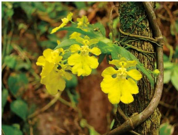
Figura 1. Erycina crista-galli creciendo en el tallo de un cafeto, en un cafetal tradicional en la región del Soconusco, Chiapas, México.

Unas 50 especies de orquídeas miniaturas se ha observado creciendo en los cafetos en la región del Soconusco, de las cuales las especies más habituales, y en varios casos amenazadas según la NOM-ECOL-059-2010, tales como: Barkeria obovata (C. Presl) Christenson, Barkeria skinneri (Bateman ex Lindl.) Lindl. ex Paxton (Protección Especial) , Barkeria spectabilis Bateman ex Lindl., Campylocentrum micranthum (Lindl.) Rolfe, Campylocentrum microphyllum Ames & Correll, Dichaea muricatoides Hamer & Garay, Ionopsis satyrioides (Sw.) Rchb. f. (Protección Especial) , Kefersteinia tinschertiana Pupulin (Protección Especial) , como Kefersteinia lactea , Leochilus cf. carinatus (Knowles y Westc.) Lindl., Leochilus labiatus (Sw.) Kuntze, Leochilus oncidoides Knowles & Westc., Leochilus scriptus (Scheidw.) Rchb. f., Lepanthes acuminata subsp. acuminata Schltr., Lepanthes oreocharis Schltr., Lockhartia verrucosa Lindl. ex Rchb. f., Notylia barkeri Lindl., Oncidium guatemalensis M. W. Chase & N. H. Williams (Amenazada) , como Sigmatostalix guatemalensis , Oncidium poikilostalix (Kraenzl.) M. W. Chase & N. H. Williams, Ornithocephalus tripterus Schltr., Plectrophora alata (Rolfe) Garay, Pleurothallis matudana C. Schweinf., Pleurothallis nelsonii Ames (Protección Especial) , Restrepia trichoglossa F. Lehm. ex Sander (Amenazada) , como Restrepia lankesteri ,