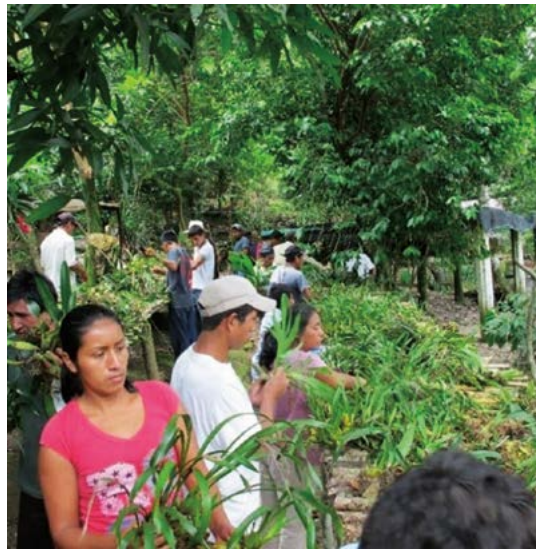
Figura 3. Brigada de Rescate del Ejido Santa Rita de las Flores, del Municipio de Mapastepec, Chiapas, México, trabajando con miles de plantas de orquídeas rescatadas en terrenos del ejido, en solo dos días.

una de las UMAs tres de los hijos del grupo original han desarrollado un pequeño negocio para la producción de artesanías usando las flores de las orquídeas producidas en las galeras de la UMA. En otra UMA los participantes recuperan un poco de lo invertido mediante visitas guiadas. Cabe mencionar que en todo momento la Educación Ambiental forma parte primordial de cualquier estrategia para el desarrollo sustentable y conservación de la biodiversidad, y de la misma manera forma