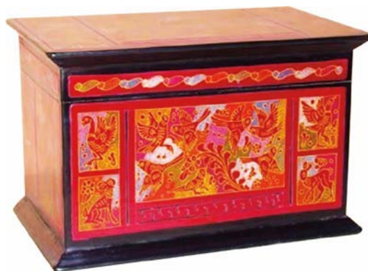
Figura 2. Urna cineraria de olinalá ( Bursera linaloe (La Llave) Rzed) con motivos tradicionales.

la viabilidad de mercado, económica y financiera para la microempresa y tomar la decisión de dar un giro. Se llevó a cabo una investigación en diversas funerarias y centros de cremación en