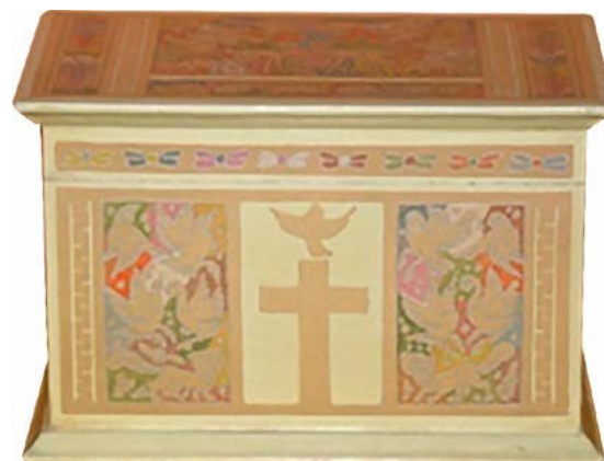
Figura 4. Urna cineraria con motivos religiosos

Si el precio de venta por unidad producida es de $1,000.00 MX y el costo variable unitario es de $500.00 MX, quiere decir que cada unidad que se venda, contribuirá con $500.00 MX para cubrir los costos fijos y las utilidades operacionales del taller. Respecto al punto de equilibrio de Carmín Artesanos, con un valor de venta por urna de $1,000.00 MX, se obtuvo que a partir de 323 unidades en el año se comienzan a generar utilidades. Se eligió hacer la evaluación con una tasa de interés aproximada de 12% que cobra la FND y 4% que es lo máximo que paga una institución financiera, en una proyección a 20 años, por lo que considerando en un primer escenario el uso de recursos propios y en el segundo utilizando financiamiento, mostró un valor actual neto (VAN) de $862,012.00 MX en el primero año, mientras que para el segundo año, un VAN de $772,362.00 MX; y tasa interna de retorno (TIR) sin financiamiento de 16% y con financiamiento de 18.6%. La resultante de costo beneficio (B/C), fue de 1.19 antes financiamiento y 1.1 después de éste, durante la vida útil de proyecto, con tasa de actualización de 4%. De acuerdo a los cálculos realizados la mejor opción fue operar