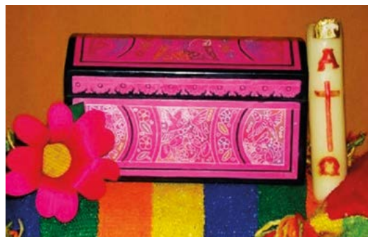
Figura 3. Urna cineraria de olinalá ( Bursera linaloe (La Llave) Rzed) con cirio.