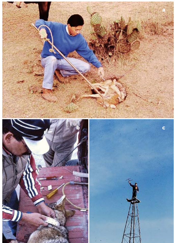
Figura 3 a: Momento de la contención química del coyote para retirar la trampa y liberarlo después de la toma de muestras y colocación de radio transmisores. b: Colocación del radio transmisor para el monitoreo de movimientos y área de actividad del coyote. c: Monitoreo por telemetría para la localización de coyotes con radiotransmisores.