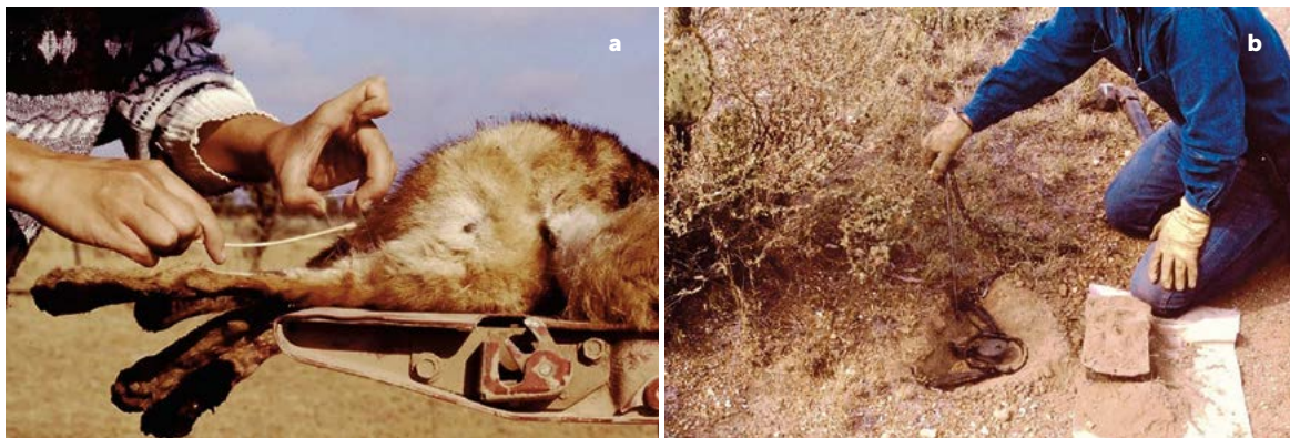
Figura 1. a: Toma de frotis vaginal para la determinación de la etapa reproductiva mediante histología vaginal exfoliativa. b: Trampas empleadas en la captura de coyotes con bordes de goma que impidieron su daño durante el estudio.