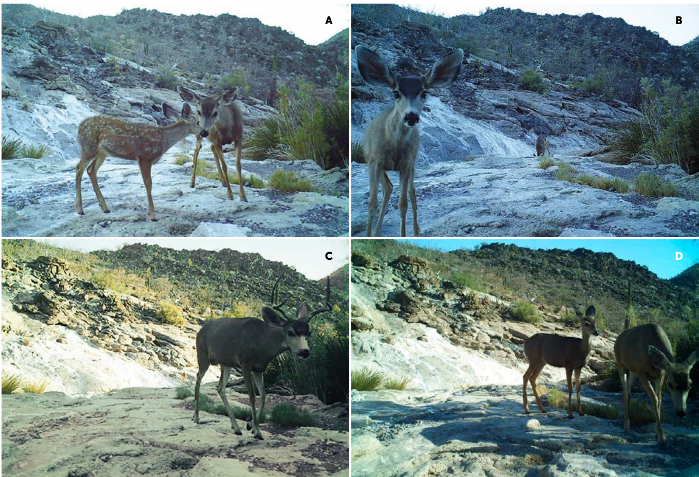
Figura 4. A: Cría con su madre en el mes de junio. B: Macho Juvenil y su madre tomando agua. C: Macho de ocho puntas después de beber agua. D: hembra con cervatillo en el mes de agosto.

visitas a los agujajes aumentaron en respuesta al incremento de temperatura ambiental. En consideración con el total de registros de los venados, aparentemente estos agujajes son preferidos por las hembras con sus crías, y posiblemente son