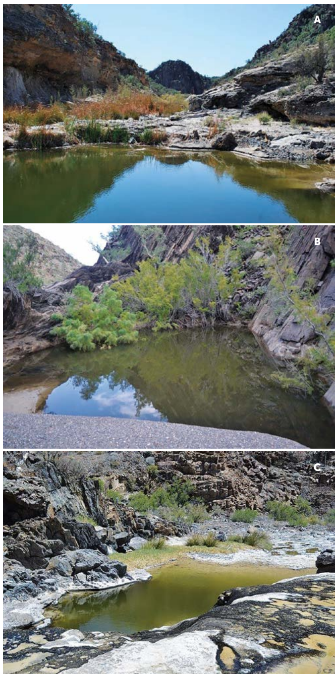
Figura 1. A: Aguaje El Volcán; B: El Junco; C: El Cordero, Sierra Santa Isabel, Baja California, México.

de las hembras aumento significativamente de enero-agosto en comparación con los registros de machos ( Chi-cuadrada=28, g.l.=016, p=0.03162 ). El mes con la mayor frecuencia relativa fue agosto ( Fr=0.5 , Figura 2a), que coincidió con el período más seco del año, con temperaturas máximas de 45 °C. Resultados similares se reportan en Arizona (Hervert y Krausman, 1986; Hazam y Krausman, 1988), quienes concluyen que la frecuencia de visita se aumenta en los meses más calurosos (julio-septiembre), incluso los venados