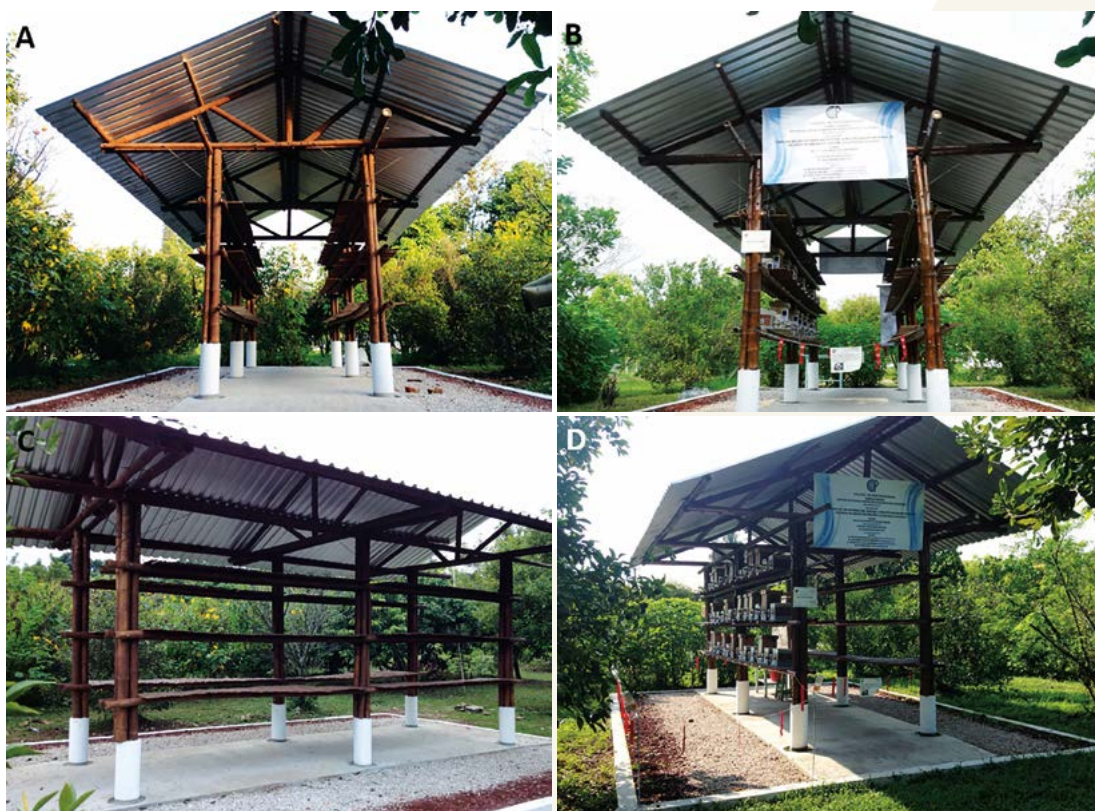
Figura 5. A: Vista lateral de meliponario Campus Córdoba-CP sin cajas. B: Vista lateral de meliponario Campus Córdoba-CP con colonias de Scaptotrigona mexicana alojadas en caja. C: Vista frontal lado norte del meliponario Campus Córdoba-CP sin cajas. D: Vista angular de meliponario Campus Córdoba-CP con colonias de S. mexicana en caja.