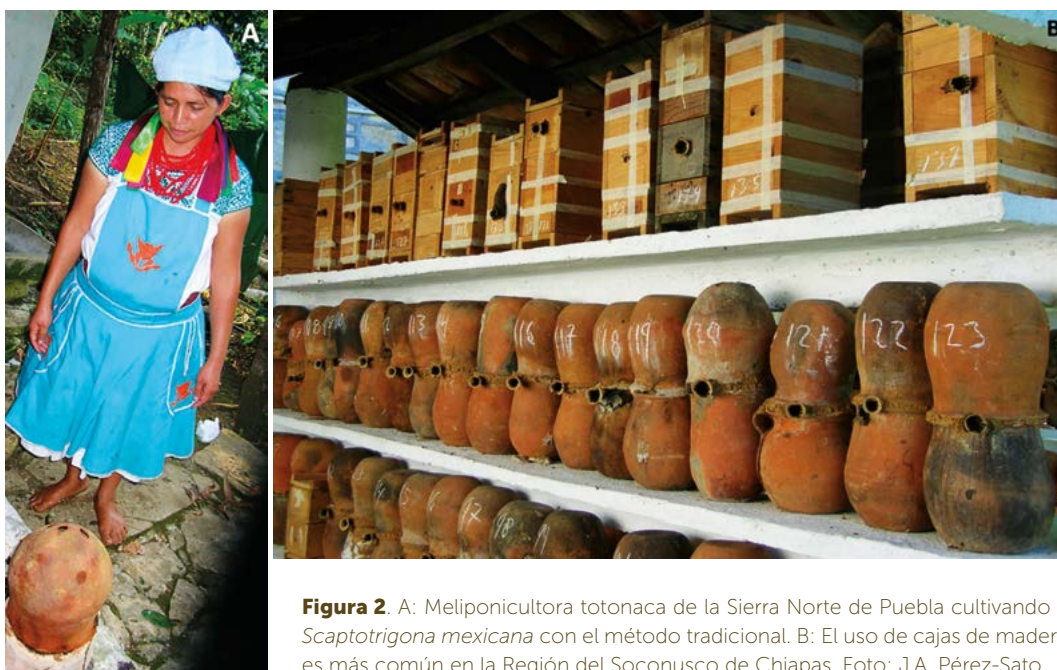
Figura 2. A: Meliponicultora totonaca de la Sierra Norte de Puebla cultivando a Scaptotrigona mexicana con el método tradicional. B: El uso de cajas de madera es más común en la Región del Soconusco de Chiapas.