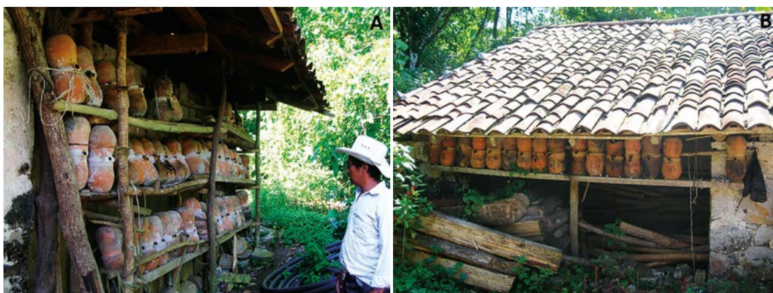
Figura 3. Meliponarios rústicos en Cuetzalan, Puebla, México.

cuyas cerchas soportan cargas axiales y le dan consistencia para resistir vientos, cubriendo con lámina acanalada, para proteger a las colonias de los rayos solares y de la lluvia (Baquero y Stamatti, 2007; Vollet-Neto et al., 2015). Las cerchas están sostenidas por seis columnas de bambú anclados a una base de cemento, que en su encuentro con el piso del pasillo, presentan una canaleta de 5 cm de ancho x 5 cm de profundidad para el control de insectos, tales como hormigas (Baquero y Stamatti, 2007). En las columnas se instalaron vigas paralelas donde se construyeron seis estantes, para colocar modelos de cajas tecnificadas de madera como la Portugal-Araujo (Pérez-Sato et al., 2013; González-Acereto, 2008) o bien el modelo Ailton-Fontana (Fontana, 2013). Cada estante tiene una capacidad para 12 cajas modelo Ailton-Fontana modificada, dado que son de mayor dimensión (39