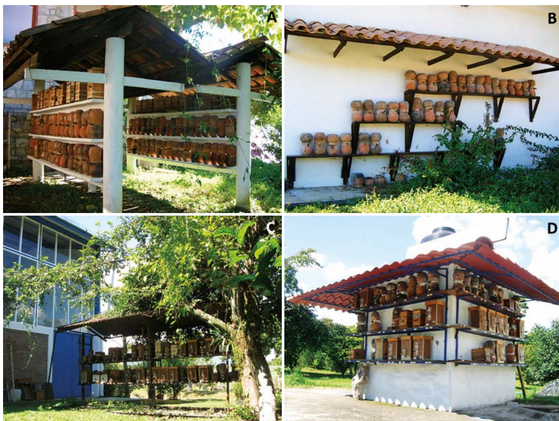
Figura 4. A: Meliponarios modernos para la crianza de Scaptotrigona mexicana , localizados en Cuetzalan, Puebla. B: En la Tosepan, Puebla. C-D: En el Campus Córdoba del Colegio de Postgraduados.