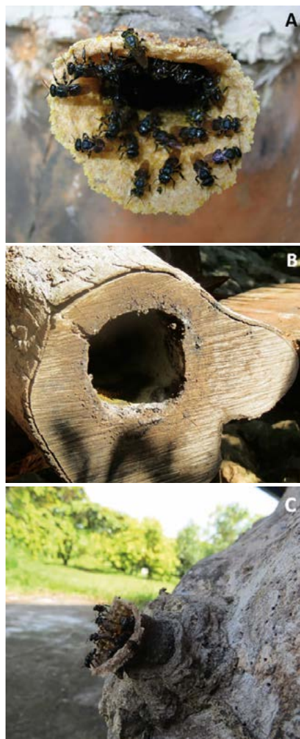
Figura 1. A: Abejas sin aguijón Scaptotrigona mexicana en tubo de entrada. B: Colonia de abeja sin aguijón S. mexicana habitando de forma natural en el hueco del tronco de un árbol. C: Tubo de entrada en tronco de árbol.

La miel, polen, propóleo y cerumen almacenado en el nido de S. mexicana tiene un alto valor medicinal, nutrimental y cultural; culturas ancestrales generaron el conocimiento y técnicas para el manejo de esta abeja, actividad conocida como meliponicultura (González-Acereto, 2008). En México, los Totonacas y Nahuas de la sierra norte de Puebla, San Luís Potosí y el estado de Veracruz en México, cultivan S. mexicana , con el método ancestral de uso de ollas de barro