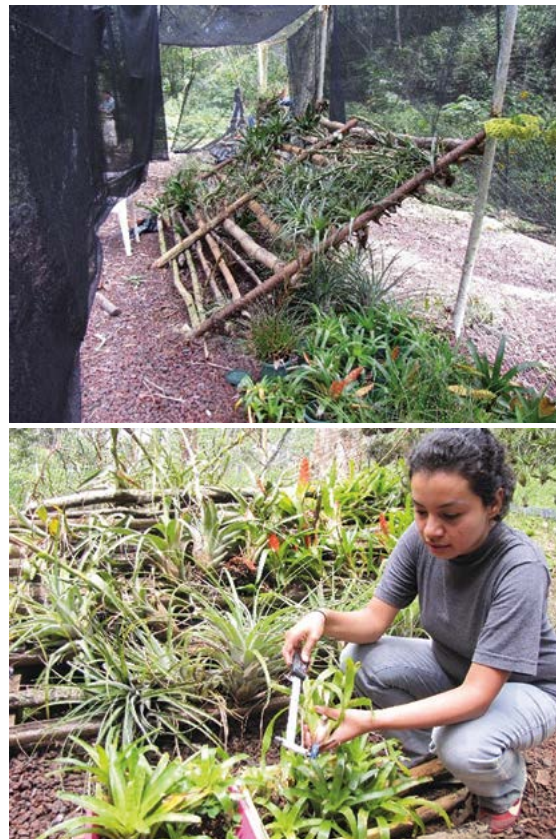
Figura 3. Vivero rústico de epífitas (tenchos, orquídeas y helechos) en Finca Nebel, Coatepec, Veracruz, México.

que crecen en los árboles de las fincas y que pueden ser propagadas en viveros rústicos de muy baja inversión inicial (Toledo-Aceves et al. 2013). Existe un gran potencial para la diversificación productiva de los SAF en café, basado en la complementariedad del conocimiento tradicional campesino y la investigación y el desarrollo tecnológico que pueden aportar diversas instituciones en el país.