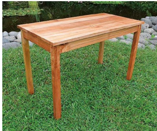
Figura 2. Mesa hecha de madera de ixpepe ( Trema micrantha ), nótese el veteado y acabado parecido a la caoba.

Para garantizar la comercialización exitosa y sostenida de la madera y las epífitas, es necesario resolver algunos impedimentos, tales como la desintegración de las fincas como unidades productivas, largos trámites para obtener autorizaciones para Unidades de Manejo para la Conservación de la Vida Silvestre (UMA), y falta de estudios de mercado, regionales y nacionales. Otro impedimento es que la mayoría de las especies maderables tienen edades mínimas para aprovechamiento de más de 20 años. A fin de asegurar un abasto mínimo y constante de epífitas o volumen de madera, los pequeños productores necesitan asociarse y organizarse en grupos de productores con procesos y control de calidad uniformes. Es importante señalar que la conservación y la restauración del BMM no ocurrirá si se sigue perdiendo superficie boscosa y si no se adopta una política pública, tanto ambiental como de desarrollo rural, basada en un ordenamiento ecológico que garantice la existencia suficiente de fragmentos remanentes de bosques y corredores biológicos (incluyendo cafetales y otros sistemas agroforestales) que permitan mantener su integridad y funcionamiento, y brindar sus valiosos servicios ambientales. En el lado positivo, como hemos visto en este trabajo,