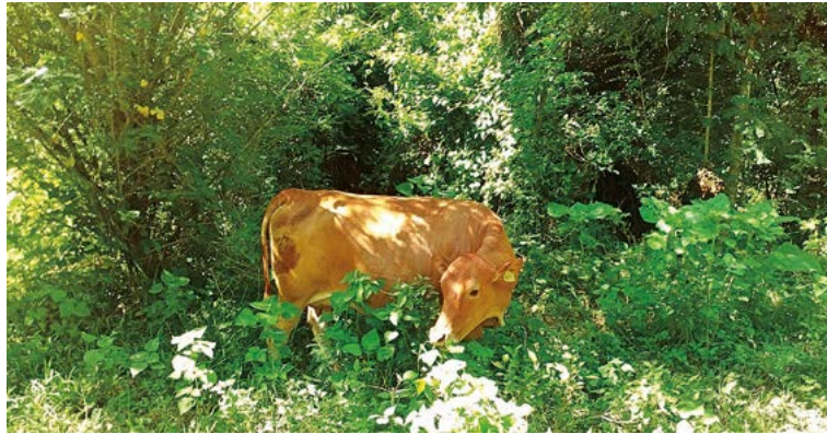
Figura 2. Ganado criollo ( Bos taurus ) raza Lechero Tropical en un Sistema Silvopastoril de Árboles dispersos en potrero con vegetación mixta.

ganado. Murgueitio (2009) los define como un sistema agroforestal para la producción animal que