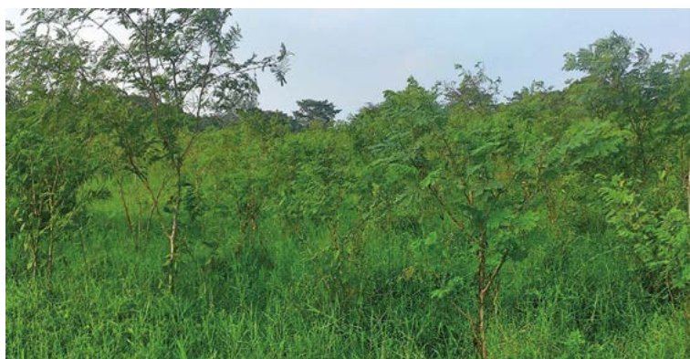
Figura 3. Sistema Silvopastoril intensivo con árboles de guaje ( Leucaena leucocephala ) a una densidad de 8500 plantas \text{ha}^{-1} asociado con pasto pangola ( Digitaria eriantha ).

combina arbustos forrajeros a densidades altas (entre 7 mil y 60 mil plantas \text{ha}^{-1} ) intercalados con pasturas mejoradas y árboles maderables o frutales a una densidad de 50 por ha. Este sistema adquiere el término de intensivo debido a la alta carga animal y a periodos cortos de ocupación y descanso prolongado. A pesar de que los SSPi son más comunes en regiones tropicales de clima cálido, se tiene evidencia que muestra su eficacia en regiones de