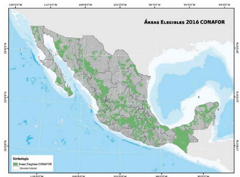
Figura 3. Áreas elegibles de apoyo por la CONAFOR.

dación de los mismos. Dichas acciones las realizan, en la mayoría de los casos, los ejidatarios, comuneros o trabajadores de campo, asesorados por técnicos externos (parte del apoyo económico proporcionado es para el pago de la asesoría técnica), donde se ejecutan tecnologías de fácil realización y económicas, para las cuales se emplea mano de obra local y materiales disponibles en la comunidad, generando una retribución económica a las personas participantes, a través del apoyo proporcionado. Dentro de cada programa se debe cumplir con los requisitos que se establezcan en los documentos que los rigen para poder acceder a los apoyos. Los que destacan como más importantes son: acreditar la legal propiedad del predio, cumplir con los requisitos de cobertura de copa, y el área o polígono deben estar en áreas elegibles; y con respecto a éste último requisito, la CONAFOR publica e las áreas elegibles (Figura 3), dentro de las cuales se ubica el BMM con 933,876 hec-