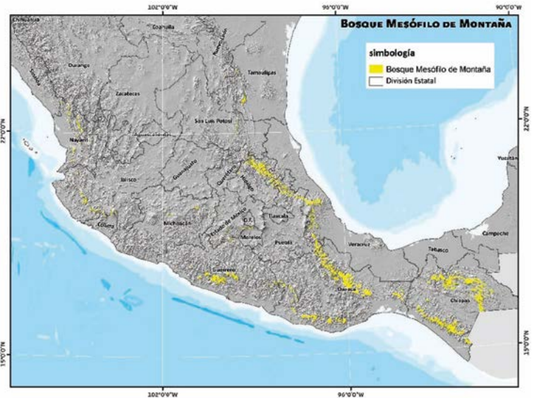
Figura 2. El bosque mesófilo de montaña en México. Modificado de la Serie IV, INEGI (2010).

El bosque mesófilo de montaña (BMM) es un ecosistema que, de acuerdo con información extraída de la carta de uso de suelo y vegetación del INEGI (serie 4), abarca menos de 1% de la superficie nacional con 1.8 millones