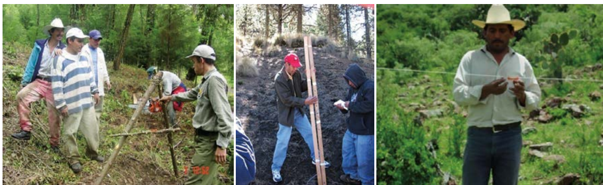
Figura 6. Aparato A (triángulo chino), nivel de manguera e hilo para trazar curvas a nivel.

procurarse que se desarrollen cerca del área a restaurar y cumplan con los requisitos de altura, grosor de tallo entre otros. El año siguiente deberá realizarse el mantenimiento de las acciones anteriores, principalmente de la reforestación, esto con el fin de que la supervivencia sea de por lo menos 80%.