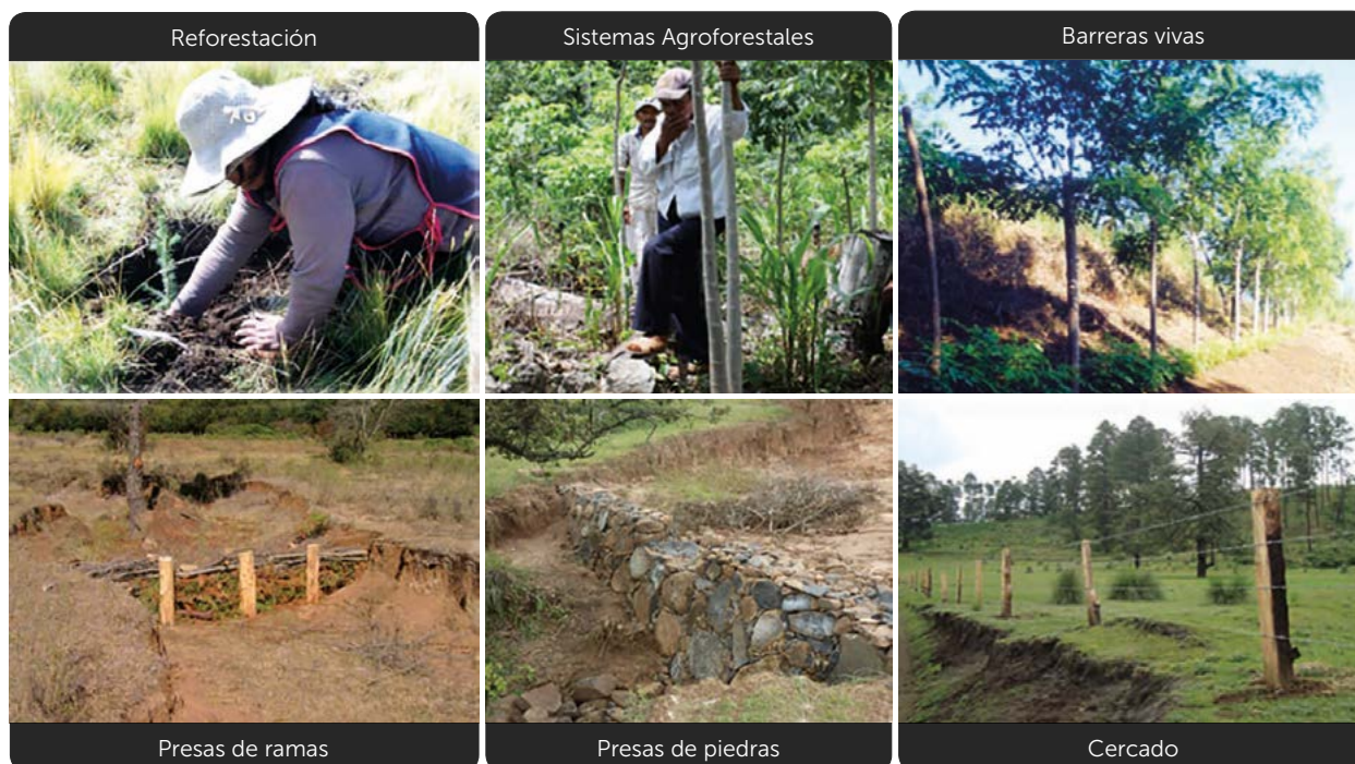
Figura 5. Prácticas de conservación y restauración de suelos.

previamente establecidas y se tracen sobre curvas a nivel, para su trazo correcto se utilizan instrumentos rústicos como el aparato A ("triángulo chino"), el nivel de manguera o el nivel de hilo (Figura 6). Las prácticas se realizan de manera manual, sin embargo, puede usarse maquinaria en lugares accesibles por su topografía. La reforestación debe realizarse preferentemente con especies nativas; las plantas a reforestar son proporcionadas por la CONAFOR o se pueden comprar, pero deberá