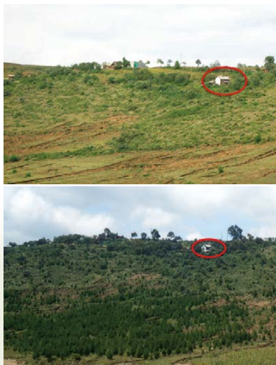
Figura 7. Ejido Acolihua, Puebla, México, antes y después de la realización de prácticas.

proyectos son las personas beneficiarias quienes se dedican al cuidado de esa superficie intervenida. Algunos casos exitosos son ejido Catedral, en Chihuahua; Ejido 16 de Septiembre, en Durango; comunidad San Nicolás Coatepec y el ejido Palizada, ambos en el Estado de México; bienes comunales la Encarnación, en Hidalgo; Santiago Tilantongo, Oaxaca; comunidad indígena de Cherán, en Michoacán; y ejido Acolihua en Puebla (Figura 7), entre otros más.