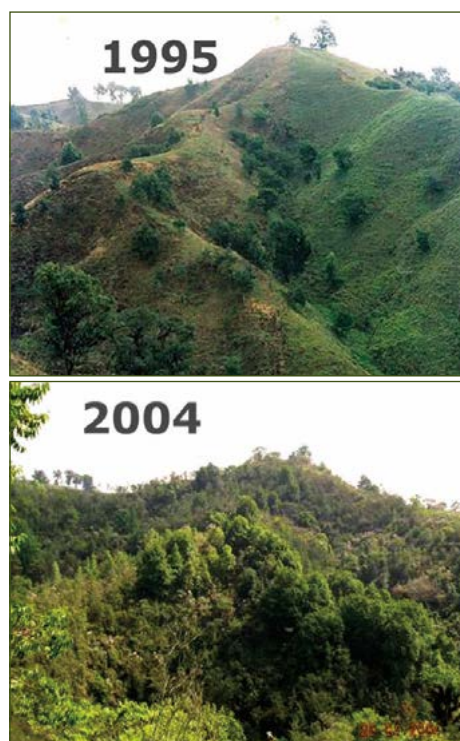
Figura 2. Restauración pasiva del bosque de Niebla en el centro de Veracruz.

No todos los bosques secundarios tienen altos niveles de biodiversidad; en muchos de ellos el constante disturbio o la extracción selectiva ha provocado la pérdida de especies. En estos casos, la introducción de especies claves puede ser muy útil, de alto valor de con-