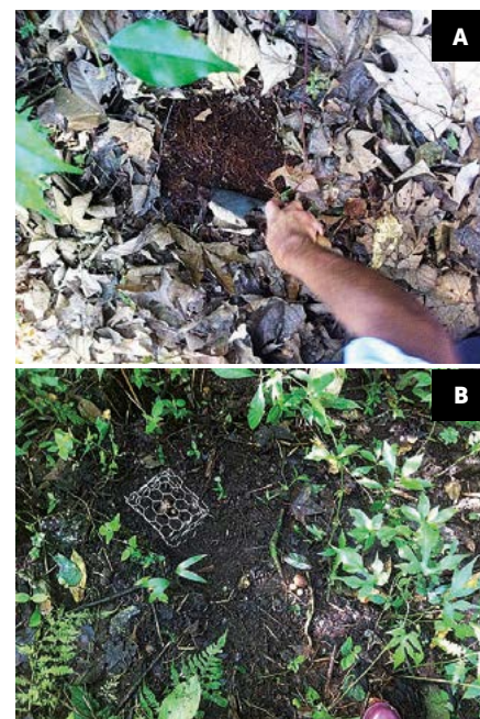
Figura 5. A: Introducción directa de semillas pre-hidratadas de Oreomunnea mexicana a nivel experimental en un bosque secundario. B: Experimento de introducción de semillas de tres especies del género Quercus , donde se prueba la germinación y remoción de semillas protegidas contra las no protegidas de la depredación de ardillas en un bosque degradado.

Espinosa (2016), se debe implementar un marco de colaboración para construir conjuntamente modelos o esquemas de restauración de bosques a diferentes escalas, desde el nivel de cada propietario hasta el del paisaje. La Figura 6 muestra las técnicas que se pueden utilizar en áreas relativamente más pequeñas y con diferente aporte a la biodiversidad. Las plantaciones densas de especies nativas incrementan la biodiversidad y se podrían realizar en áreas relativamente pequeñas, pero dispersas en el paisaje para fomentar la nucleación. Estrategias para áreas intermedias puede ser la restauración pasiva, el enriquecimiento de bosques degradados o las plantaciones mixtas de especies de rápido crecimiento. Otras estrategias para áreas grandes son el establecimiento de cercas vivas o árboles aislados