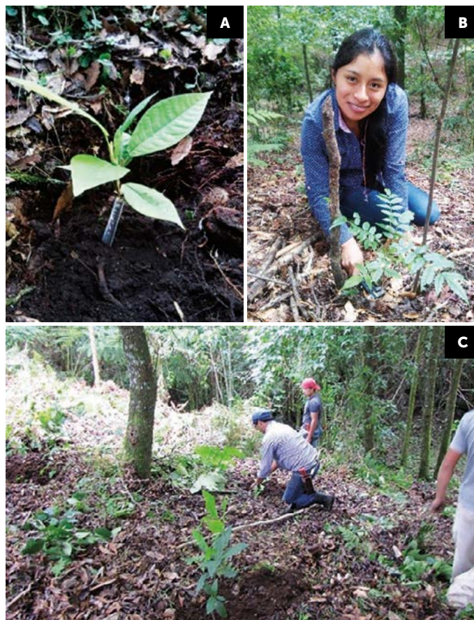
Figura 3. Actividades de enriquecimiento en nueve fragmentos de bosque de niebla degradado en la subcuenca de Pixquiac. Se han introducido 13 especies nativas incluidas en alguna categoría de amenaza y con alto valor maderable para los pobladores locales (Landerio-Lozada, en prep.). A. Magnolia dealbata B) Meliosma alba y C) actividades de siembra dentro de los bosques.

Una manera de acelerar la sucesión es la introducción de semillas de especies arbóreas, lo cual presenta la ventaja de tener un bajo costo, pero la desventaja de que la sobrevivencia de las semillas y su germinación pueden ser bajas debido a la desecación, arrastre o depredación de las semillas o plántulas recién germinadas. Los estudios de siembra directa en bosques de niebla son escasos (Williams-Linera y Pedraza 2005; Atondo-Bueno et al. , 2016) y la aplicación de esta práctica a gran escala