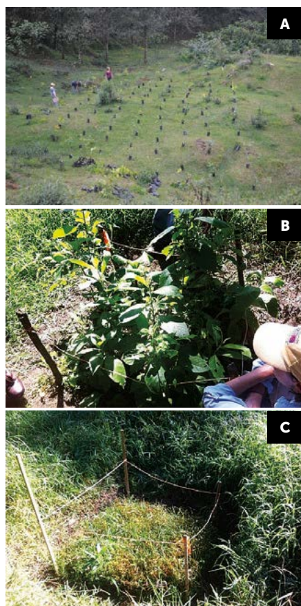
Figura 4. A: Establecimiento de una plantación núcleo con 182 individuos de ocho especies nativas, con una separación de 1.5 m entre plantas en un potrero abandonado en el centro de Veracruz, México. B: Núcleo (1x1 m) en el que se removió el pasto periódicamente y C: Área control donde no se removió el pasto.

está limitada por la falta de conocimiento de las respuestas a nivel de especie (Figura 5).