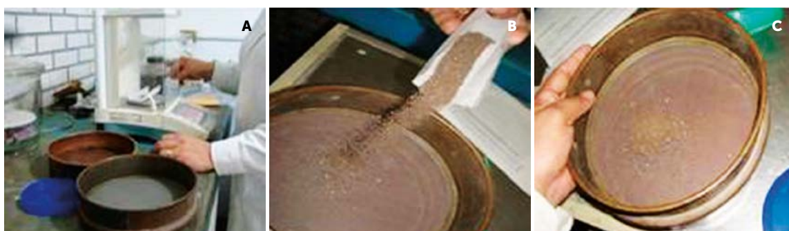
Figura 3. Secuencia para cuantificar el material parcialmente descompuesto y material fibríco: a) pesar una porción de abono orgánico, b) tamizar y c) pesar lo que quedó retenido en el tamiz.