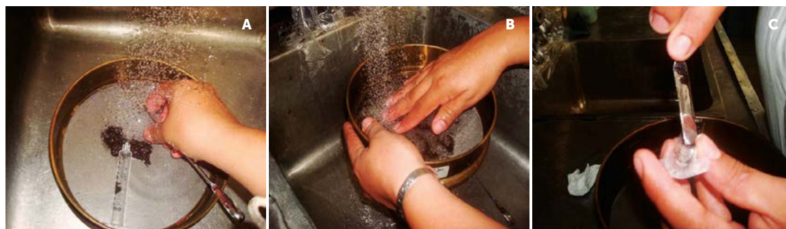
Figura 2. Secuencia para determinación de fibra frotada: a) transferir el residuo de la fibra no frotada al tamiz, b) Lavar bajo corriente frotando el abono y c) cuantificar la fibra frotada.