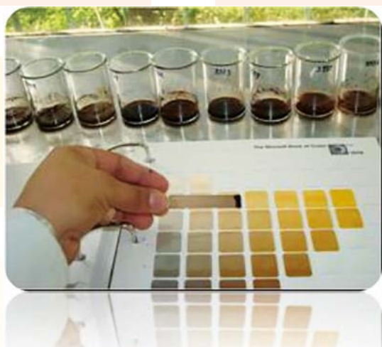
Figuran 4. Determinación del color con pirofosfato de sodio.

Cuando se realizó la lectura en seco, los colores más claros fueron registrados en pollinaza y residuo de caña, atribuido a que estos abonos no han tenido un proceso de descomposición para lograr madurez. Estos colores claros son similares a los reportados por Labrador (2002) para turbas altas (pardo-rubio).