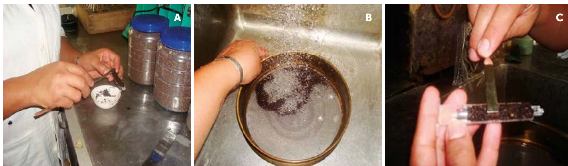
Figura 1. Secuencia en la determinación de fibra no frotada: a) llenar la media jeringa con el abono humedecido, b) lavar con una corriente de agua sin frotar y c) cuantificar la fibra no frotada.

El Cuadro 5 presenta los valores de las propiedades medidas de los abonos orgánicos. Los valores de pH cumplieron con la NMX-FF-109-SCFI-2007 (SEC, 2008) y son similares a los reportados por Labrador (2001) para compostas de gallinaza, oveja, ternera, vaca y conejo; los