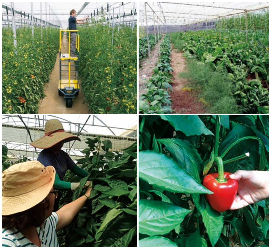
Figura 3. Sistemas de producción de hortalizas bajo manejo ecológico de la empresa Camposeven, España.