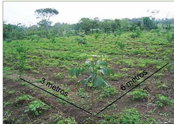
Figura 1. Distribución en el pano de siembra de la caoba ( Swietenia macrophylla King).

Los valores de N y MO fueron de 0.38% y 10.67%, Cos 1.4 (abs), los de CIC, K, Ca y Mg 5.93, 0.06, 0.82, 0.36 ( \text{Cmol}_c \text{kg}^{-1} ), respectivamente y P-Olsen 2.2 \text{mg kg}^{-1} y pH 4.7. Los valores bajos de pH y los contenidos deficitarios de nutrimentos registrados en el suelo estudiado coinciden con diversos estudios realizados para suelos ácidos tropicales (Abat et al. , 2012), la interrelación que estos elementos tienen con la química del aluminio ( \text{Al}^{3+} ) origina la formación de compuestos insolubles, en reacciones casi irreversibles (Vázquez et al. , 2009). Su disponibilidad, por efecto del encalado se explica porque, al elevarse el pH, se favorece el ambiente para la proliferación de la biota edáfica (fertilidad biológica), la cual, a contenidos altos de MO (caso del suelo en estudio) libera nutrimentos (fertilidad química) a través de la mineralización, además, la descomposición de la materia orgánica del suelo mejora la agregación y