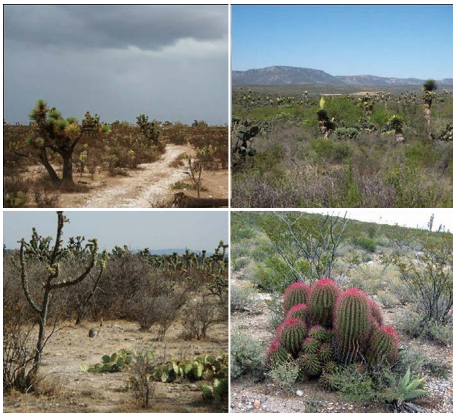
Figura 2. Tipos de vegetación en el área de estudio; domina el matorral desértico micrófilo en todas las imágenes; en las dos superiores se presenta también izotal.

tura, con base a ajustes en los criterios propuestos por Holechek et al. (1989). Para validar la densidad de indicios de lagomorfos entre las diferentes variables se aplicó la prueba no paramétrica de Kruskal-Wallis (KW), que prueba la diferencia de tratamientos o grupos de muestras independientes o de resultados de muestreo independientes (Gundale y Deluca, 2006). Para mostrar estos resultados de manera gráfica, se ordenaron usando un modelo bajo la modalidad Basic Statistic/Tables, Graphs. Ambas pruebas y modelo se realizaron utilizando el programa STATISTICA 7.1 (StatSoft Inc., 2004) con un nivel de significancia de \alpha < 0.05 .