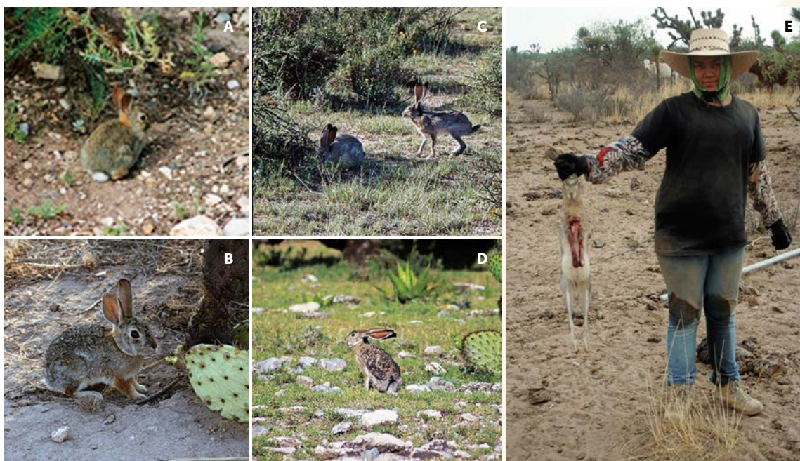
Figura 4. Lagomorfos del centro-norte de México. A-B: Conejo desértico ( Sylvilagus audubonni ). C-D: Liebre parda ( Lepus californicus ). E: Lagomorfos en la dieta de habitantes rurales.

(Chapman y Willner, 1978). Respecto a la altitud, los resultados mostraron relación significativa para liebres: (KW=32.22 p=0.0052 ), pero no para conejo (KW: H=4.4727 , p=0.3458 ). La mayor densidad de indicios de liebres fue en el rango >2,100 ; para el conejo fue entre 1,851 y 2,100 m (Figura 3E), y coinciden con el registro para las liebre parda desde el nivel del mar hasta 3,800 m (Best, 1996), y la panzagüera de 750 a 2,550 m (Best y Henry, 1993). Sin embargo, ambas liebres prefieren altitud entre 1350-2100 m (Best y Henry, 1993; Best, 1996). El conejo desértico se ubica desde el nivel del mar hasta los 1,829 m (Chapman y Willner, 1978), pero en estos resultados la distribución altitudinal fue a cotas más altas. Por último, en lo que respecta a la cobertura basal de pastos y la densidad de lagomorfos, hubo diferencias significativas para las liebres (KW H=46.233 , p=0.0006 ) y para conejo (KW: H=30.535 , p=0.0032 ). Para ambas especies se encontró una densidad marcada-