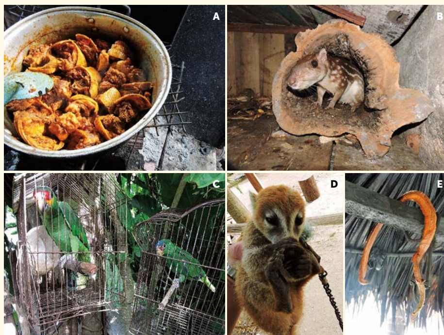
Figura 1. A: Armadillo en adobo ( Dasypus novemcinctus ). B-D: Tepescuintle ( Agouti paca ), Loros ( Amazona xantholora ), Coatí ( Procyon lotor ) como mascotas. E: Serpiente de cascabel ( C. simus ) para fines medicinales.

En relación al uso y aprovechamiento, se registró que 76% de las especies son utilizadas como alimento de familias (Figura 1a, b), 13% tienen uso medicinal (Figura 1c), 10% como mascota (Figura 1d, e) y 1% tiene uso mítico; siendo los mamíferos, reptiles, aves y reptiles las especies más empleadas para cada caso respectivamente (Figura 2). En Yucatán, Montiel et al. (1999) reportan tres usos potenciales de la fauna silvestre, subsistencia ali-