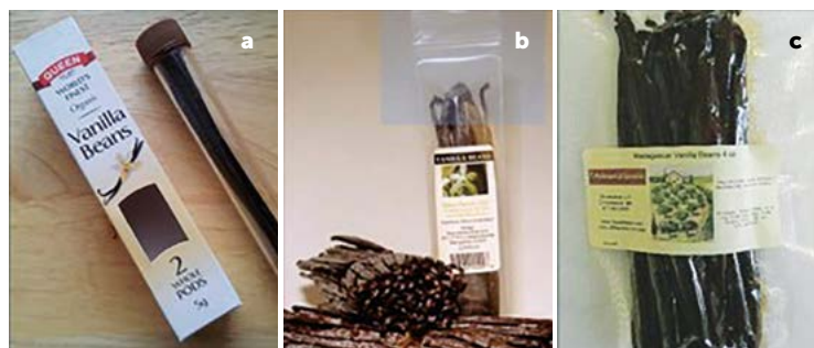
Figura 1. Presentaciones comerciales de frutos de Vanilla planifolia comercializada al menudeo. a: vidrio; b: polietileno; c: al vacío.

Se probaron los materiales de Celofán (C), Polietileno de baja densidad (P) y Polietileno para vacío (V), comprobando su espesor y tasa de permeabilidad al vapor de agua (Figura 2). Las evaluaciones de calidad se realizaron