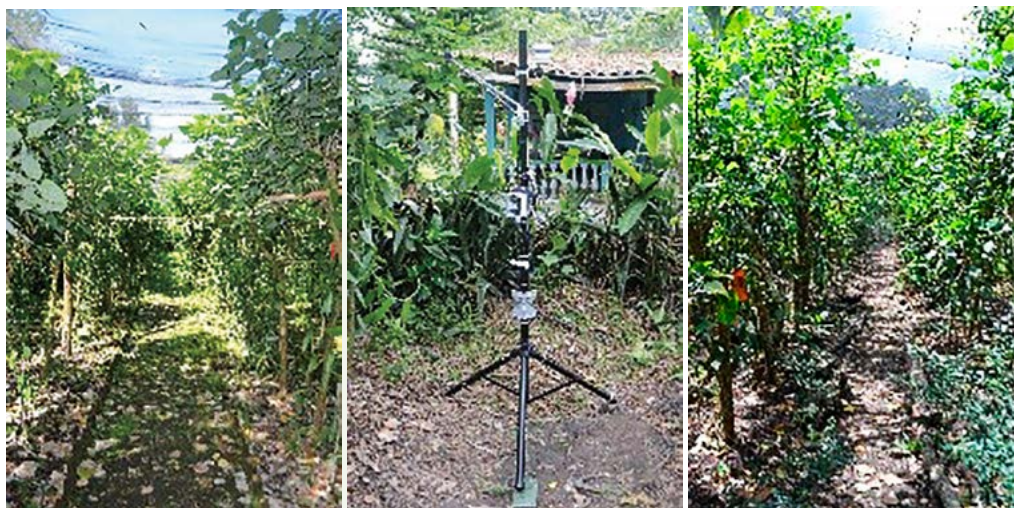
Figura 1. Sistemas de casas sombra para producción de Vanilla planifolia en Papantla y San Rafael, Veracruz, México.

cuanto a luminosidad y humedad del suelo. Cada casa sombra tuvo un comportamiento diferente, aún aquellas de la misma región, mientras que la humedad del suelo tuvo menos variación, aumentando notablemente en algunos meses, asociado a posibles eventos de riego por los propietarios. El porcentaje de frutos retenidos hasta la cosecha fue del 68% y 51% en los años 2014 y 2015 respectivamente, con variaciones en tamaño y peso. Históricamente, en el año 2013, se registró que los cultivos de vainilla evaluados en San Rafael fueron más con-