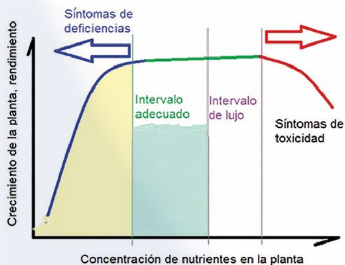
Figura 1. Respuesta general de las plantas al aporte de nutrimentos.

Incorporar materia orgánica en degradación a las camas de vainilla para proveer al suelo de nutrientes esenciales y mantener su fertilidad. La vainilla al ser una orquídea busca carbono orgánico soluble para nutrirse. Instalar sistemas de riego localizado en épocas de menor precipitación para reducir la temperatura en la rizósfera y favorecer absorción de nutrientes. Realizar muestreos regulares de tejido vegetal y suelo para determinar el estado nutricional de la planta de vainilla en diferentes etapas fenológicas y adecuar la fertilización o abonado. Usar árboles como tutores o mantener los vainillales rodeados por éstos para conservar posibles hongos benéficos que favorezcan la nutrición de las raíces de vainilla (hongos micorrízicos).