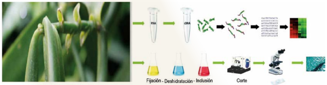
Figura 1. Metodología de obtención del transcriptoma diferencial de dos genotipos de V. planifolia con y sin caída prematura de fruto.

Existe un patrón diferencial en la expresión de genes y rutas metabólicas involucradas en el proceso de abscisión o "caída prematura de fruto" en vainilla. La Figura 2A muestra el genotipo CH-I sin abscisión prematura,