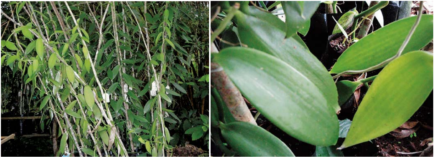
Figura 3. Comparación de tamaño de hojas y clorosis en estacas de vainilla por adición de vermicompost.