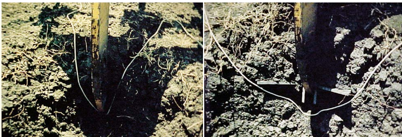
Figura 2. Efecto sobre el área de suelo fracturada con una modificación al diseño de la herramienta de labranza.

un análisis descriptivo de la interacción entre diferentes herramientas de labranza y el suelo, lo que permitirá entender y predecir el tipo de efecto que ocasionaría una herramienta de una forma dada sobre el suelo, para así apoyar su apropiada selección. La descripción y análisis servirá, asimismo, como apoyo en el diseño de nuevas y más eficientes herramientas agrícolas.