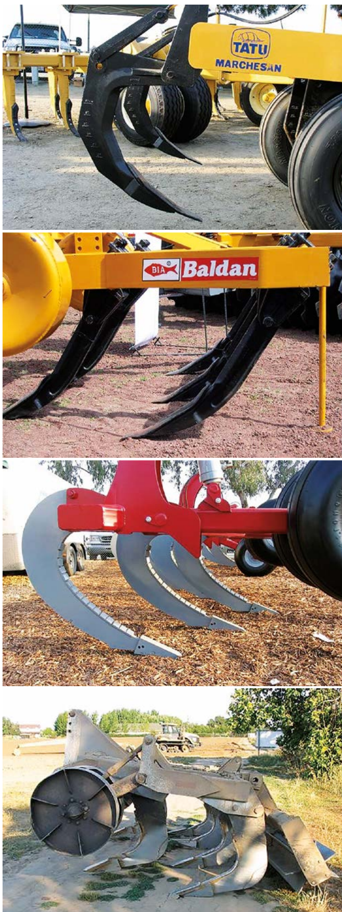
Figura 4. Herramientas de labranza del tipo de arrastre con diferentes configuraciones de diseño.

terrones que se formaron de operaciones previas de labranza son fragmentados, las malezas son arrancadas, las semillas, herbicidas y fertilizante son colocados bajo la superficie, la cual es nivelada, y la costra que se forma es fragmentada (Sitkei, 1976).