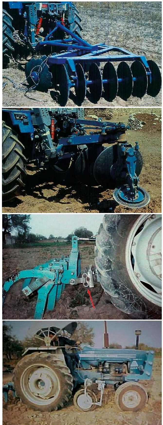
Figura 5. Instrumentos para medir la fuerza de tiro del implemento y determinar el patinaje y velocidad real de movimiento de la combinación tractor-implemento.