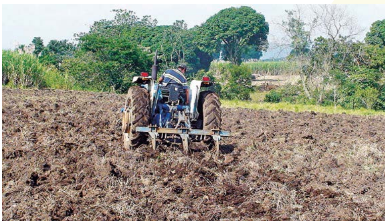
Figura 1. Labranza del suelo en la preparación de la cama de siembra.

Esta manipulación mecánica de los suelos, como muchos otros procesos tecnológicos, involucra tres elementos principales: la fuente motriz, la máquina o implemento, y el material a ser procesado; es decir, el suelo (Figura 1). Una herramienta de labranza es definida como un elemento individual en un equipo o implemento que trabaja en el suelo, como puede ser un disco del