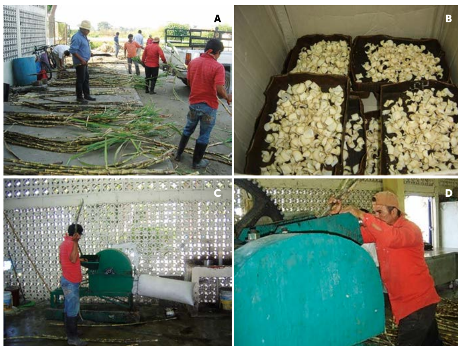
Figura 1. A: Ordenamiento de las muestras. B: Rodajas de tallo para determinar humedad en la sección 8-10. C: Picado de tallos para determinar fibra. D: Extracción de jugo del tallo.

Para generar los tratamientos se utilizó un diseño factorial 17×2 (17 semanas de muestreo [11/11/2011 a 02/03/2012] y dos variedades de caña [CP-72-2086 y Q-997]). Para el muestreo en cada parcela se tomaron nueve tallos más un hijuelo (10 repeticiones) (Figura 1). Las 340 muestras resultantes fueron procesadas en el laboratorio de Campo del Ingenio Huixtla con el método del molino de ensaye (Golcher, 1994). El Anova y la prueba de comparación múltiple de Tukey se