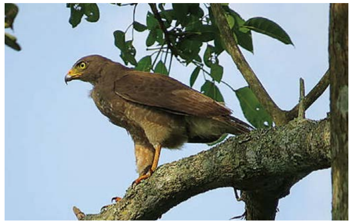
Figura 2. Buteo magnirostris (Accipitriformes: Accipitridae)

Todas las especies observadas (Cuadro 1) tienen cierto potencial en la regulación poblacional de roedores plaga del cultivo de caña de azúcar, y su importancia relativa estaría en función de su especificidad alimenticia, estacionalidad y abundancia, entre otros factores. Tomando en cuenta esto, la especie con alto potencial es E. leucurus (Figura 1) que se alimenta básicamente de roedores (Leveau et al. , 2002; Márquez-Reyes et al. , 2005) y es una especie residente registrada en 46% de los recorridos de campo (Cuadro 2), perchando alto en ramas con escaso follaje o ramas secas de árboles muertos, coincidiendo con la información de Márquez-Reyes et al. (2005), lo que se debe tomar en cuenta en las estrategias de manejo para favorecer su presencia en áreas con cultivos de caña de azúcar. Otra especie que podría tener buen potencial es B. magnirostris (Figura 2), que aunque su dieta es generalista (Márquez-Reyes et al. , 2005), es una especie residente que se detectó en 96% de los recorridos y en todos los linderos considerados (Cuadro 2). Debido a que los recorridos se realizaron en horas del día, no se obtuvo información sobre la presencia de aves rapaces nocturnas, con excepción de G. brasilianum , sin embargo, es muy probable que este grupo de aves utilice también los linderos arbóreos como sitios de percha o descanso, tomando en cuenta que varias especies ca-