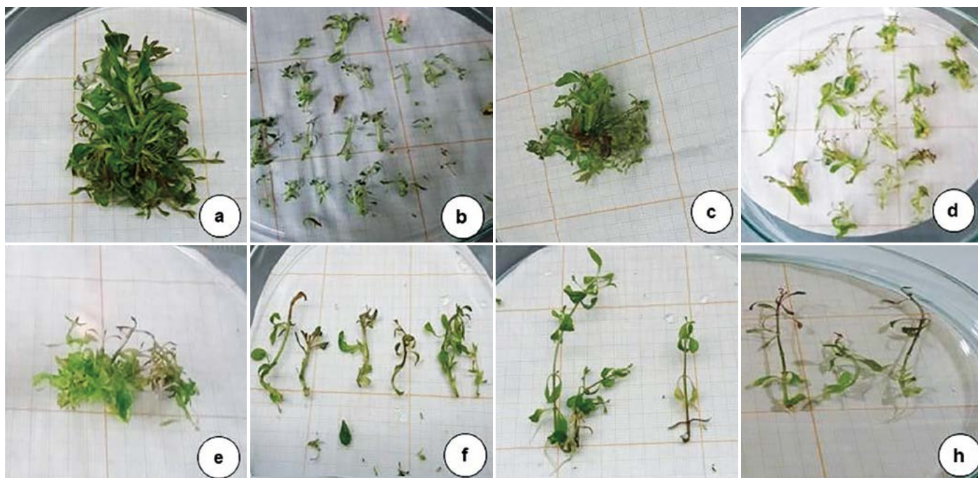
Figura 3. Respuesta al desarrollo y proliferación de brotes múltiples de miniestacas de Stevia rebaudiana Bert. Var Eirete, en medio MS (1962) a diferentes concentraciones de BAP en los tratamientos: a-b: T 3 =MS+BAP 2 \text{ mg L}^{-1} ; c-d: T 2 =MS+BAP 1.5 \text{ mg L}^{-1} ; e-f: T 1 =MS+BAP 1 \text{ mg L}^{-1} .

La desinfección del 100% de explantes de S. rebaudiana Bert. Eirete, fue exitosa cuando se realizó en dos etapas: pre desinfección con Captan® ( 3 \text{ g L}^{-1} ) en agitación 15 min seguida de inmersión en alcohol etílico al 70% (v/v) 5 min, y desinfección bajo condiciones asépticas en NaClO 5% (v/v) 10 min y posteriores enjuagues