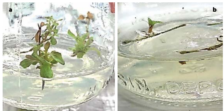
Figura 1. Desarrollo de brotes de Stevia rebaudiana Bert. var Eirete. a: miniestaca vertical mostrando la producción de brotes. b: miniestaca horizontal con desarrollo incipiente de brotes a 15 días de su crecimiento in vitro .

El análisis de varianza mostró diferencias significativas entre tratamientos para la variable número de brotes (Figura 2). El tratamiento con 2 \text{ mg L}^{-1} de BAP en el medio de cultivo MS, produjo en promedio 33 brotes por explante, considerado como el mayor promedio de brotación obtenido en el presente estudio, seguido del tratamiento con 1.5 \text{ mg L}^{-1} de BAP, y 1 \text{ mg L}^{-1} de BAP, que produjeron en promedio 19.6 y 13.6 brotes por explante respectivamente. El testigo produjo en promedio 2.2 brotes por explante.